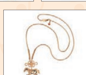
Just Gold 鴻運馬純金吊墜