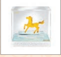
「一馬當先」純金擺件

在科技精品上，Beats by Dr. Dre 亦打造了限量版的 Beats Solo HD，用傳統金紅輝映，加上低調磨砂的特別外形，傳遞中國新年的祈福和祥和氣氛。限量版配色設計鮮艷奪目，耳罩兩側均塗上金色品牌標誌，還有模仿用毛筆寫成的「馬」字和寓意「福到」的倒轉「福」字，頭戴內部並印有3種歷代不同繁體書法的「福」字，冀好運連連。