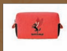
tout a coup