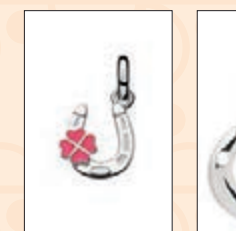
Vivienne Westwood 馬年項鍊

Vivienne Westwood 亦特意推出馬年項鍊，吊墜以今年生肖——馬為設計概念，駿馬四蹄奔馳，栩栩如生。在立體的金色駿馬吊墜上以淺色的黃寶石拼砌成 Orb，細緻而不失華麗，與金色的長項鍊匹配非常。而且，吊墜上還加添中國傳統繩結及紅色的立體 Orb 以代表吉祥和運氣。項鍊上的傳統繩結為「吉祥結」，有源源不絕、生生不息的含意；而紅色的 Orb 則在源遠流長的中國傳統中代表健康、富裕和好運。