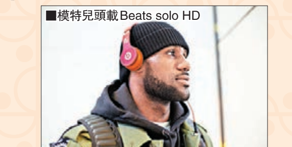
模特兒頭戴 Beats solo HD

在科技精品上，Beats by Dr. Dre 亦打造了限量版的 Beats Solo HD，用傳統金紅輝映，加上低調磨砂的特別外形，傳遞中國新年的祈福和祥和氣氛。限量版配色設計鮮艷奪目，耳罩兩側均塗上金色品牌標誌，還有模仿用毛筆寫成的「馬」字和寓意「福到」的倒轉「福」字，頭戴內部並印有3種歷代不同繁體書法的「福」字，冀好運連連。