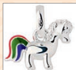
Links of London 一系列吊飾