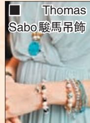
Thomas Sabo 駿馬吊飾