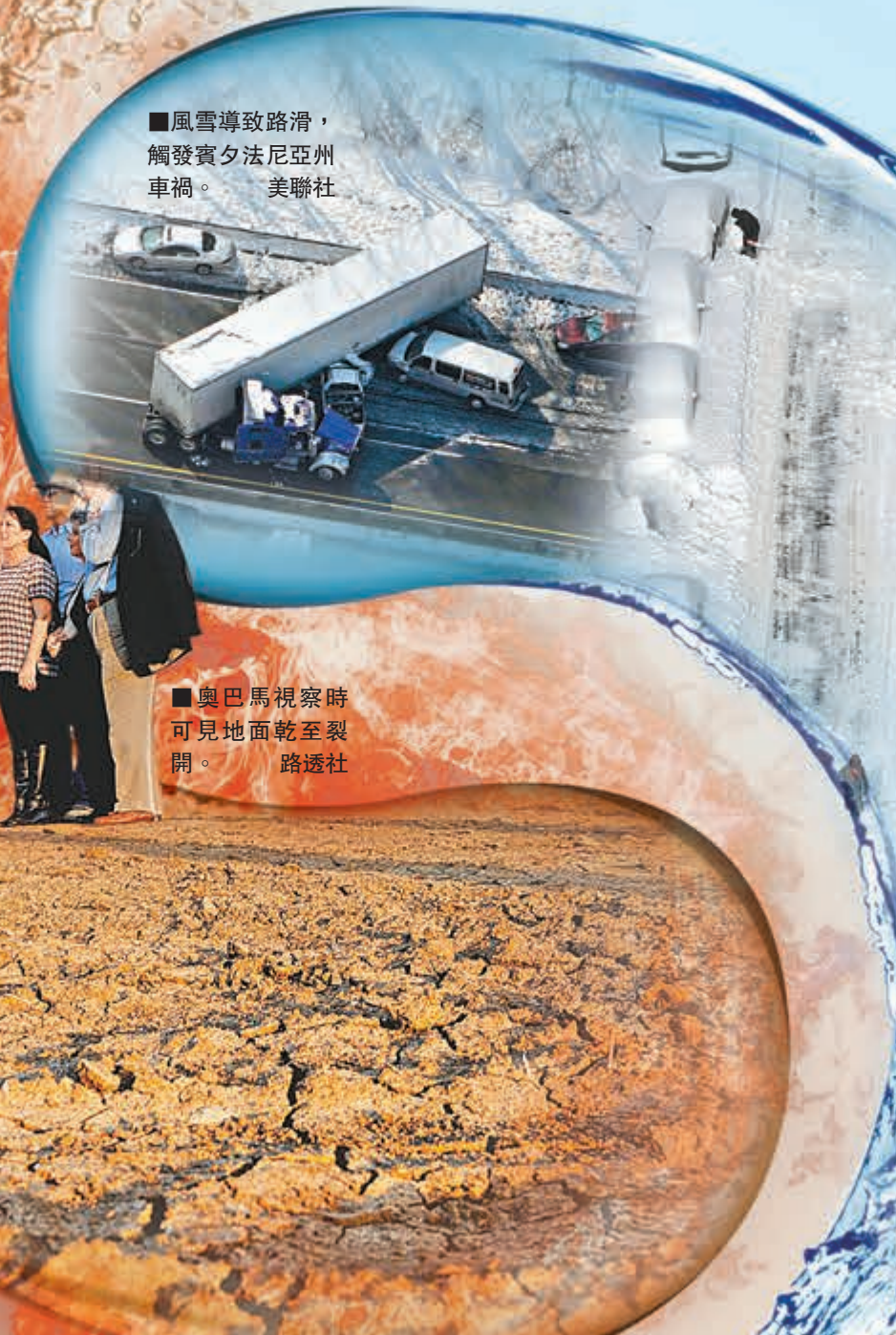
風雪導致路滑，觸發賓夕法尼亞州車禍。