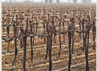
大旱令葡萄失收。

農業部前日表示，美國寒冬天氣可能導致上月玉米及大豆產量按月大減17%，按年跌13%。