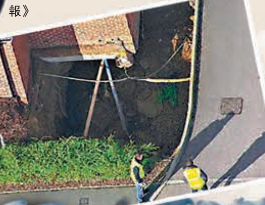
部分房屋處於地陷邊緣。