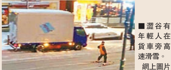
澀谷有年輕人在貨車旁高速滑雪。