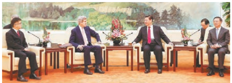
■習近平在北京人民大會堂會見克里。

會談期間，習近平與克里還就當前朝鮮半島局勢交換了意見。習近平闡述了中方有關立場。對於朝鮮這一中國近鄰，中方的立場是一貫的、明確的，就是推動實現半島無核化，維護朝鮮半島和平穩定，堅持以對話談判和平解決問題，絕不允許半島生亂生戰。中方亦願同包括美方在內的有關各方共同努力，為維護地區和平穩定繼續發揮建設性作用。