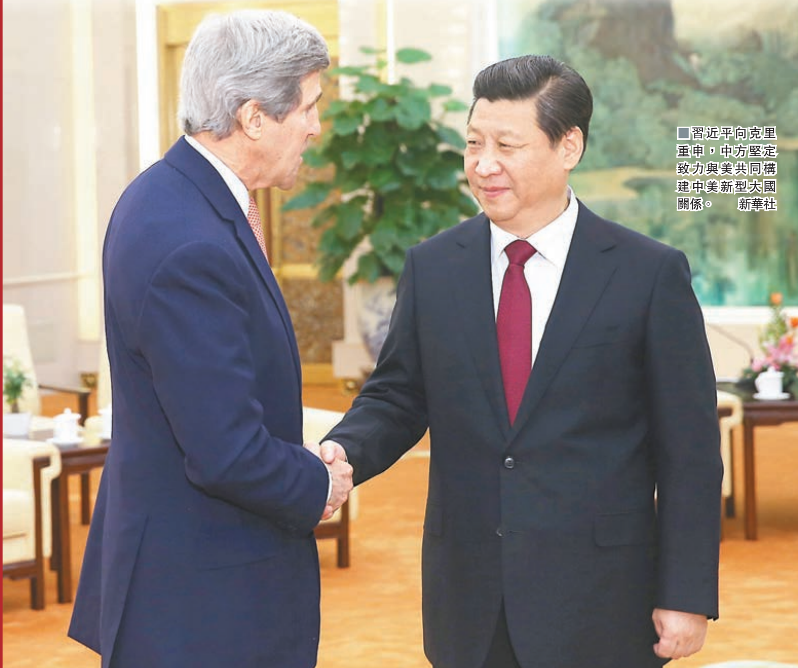
■習近平向克里重申，中方堅定致力與美共同構建中美新型大國關係。