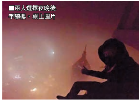
兩人選擇夜晚徒手攀樓。