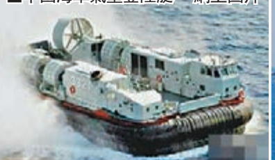
■中國海軍氣墊登陸艇。

新的一年，在深化國防和軍隊改革的大潮中，解放軍裝備系統將積極推進裝備採購制度、軍事代表制度、裝備價格工作、裝備保障體制四項改革，全面吹響改革創新的「衝鋒號」。