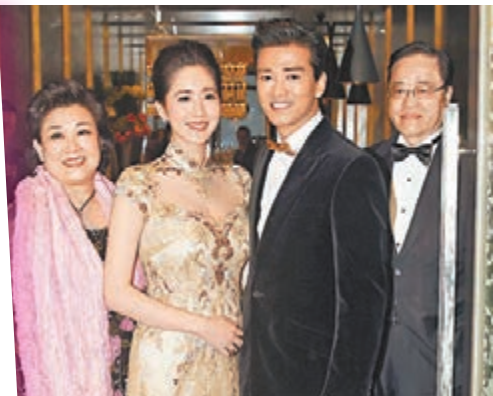
■一對新人在東東雙親陪同下見傳媒。