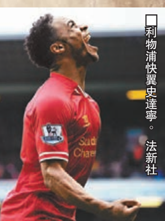
利物浦快翼史達寧。

曾報稱倫敦地鐵工人罷工，可能影響到英超賽事，明晨富咸主場對利物浦之戰或無法如期上演，需改期再戰；不過最終罷工取消，比賽料可上演，利物浦如期「劫」富。(now622台周四4:00a.m.直播)