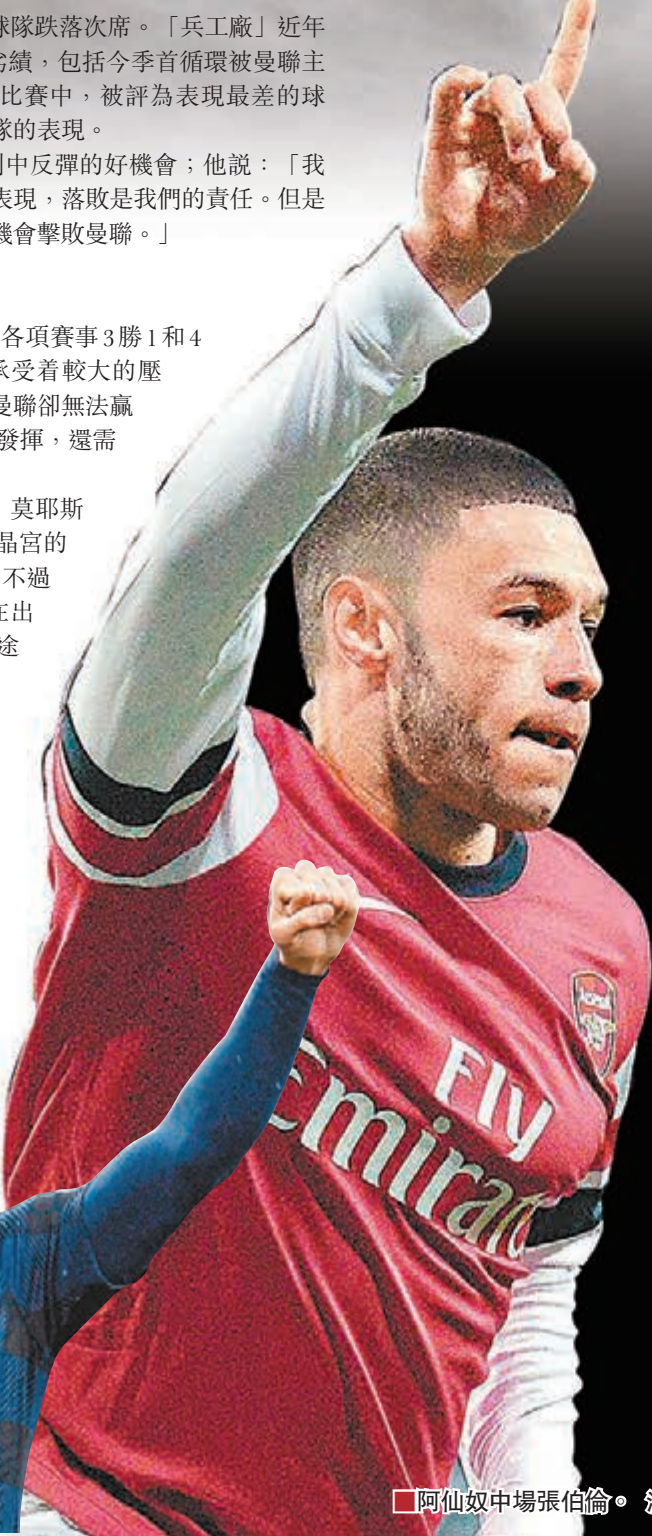
阿仙奴中場張伯倫。