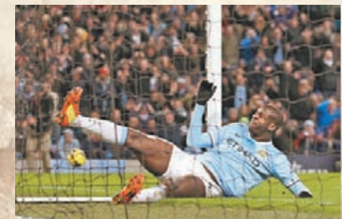
曼城大將耶耶托尼。