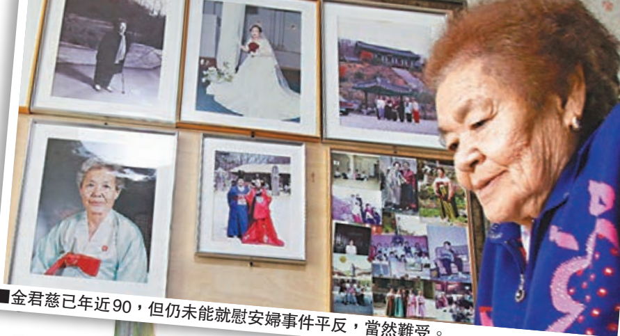
金君慈已年近90，但仍未能就慰安婦事件平反，當然難受。