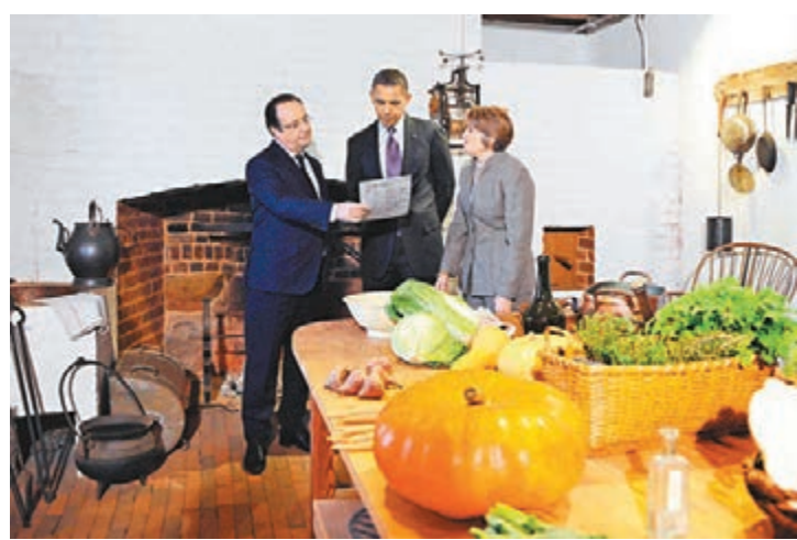
奧朗德與奧巴馬參觀傑斐遜故居的廚房。