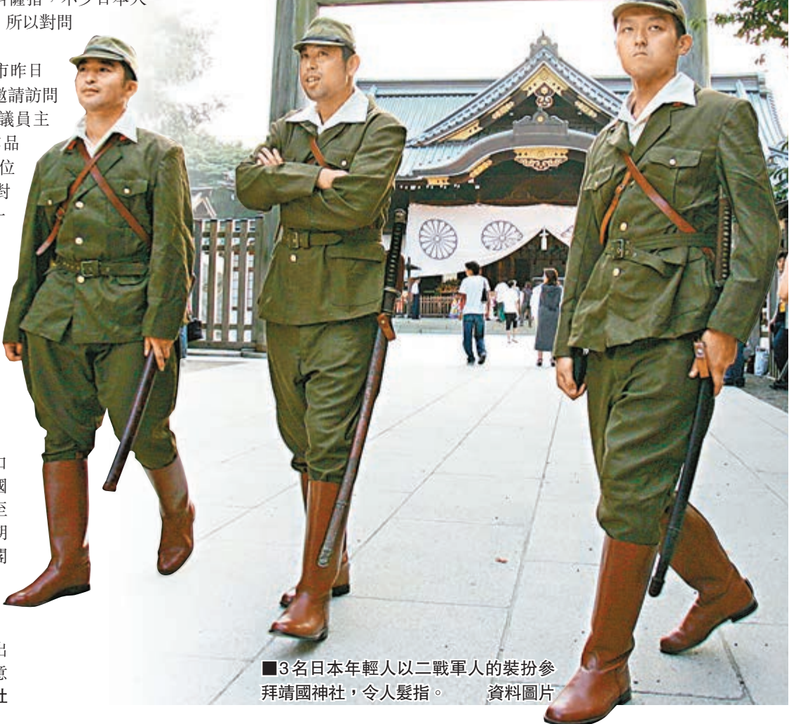
3名日本年輕人以二戰軍人的裝扮參拜靖國神社，令人髮指。