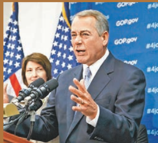
共和黨眾議員連日舉行閉門會議商討債限問題。圖為博納早前出席黨會議。