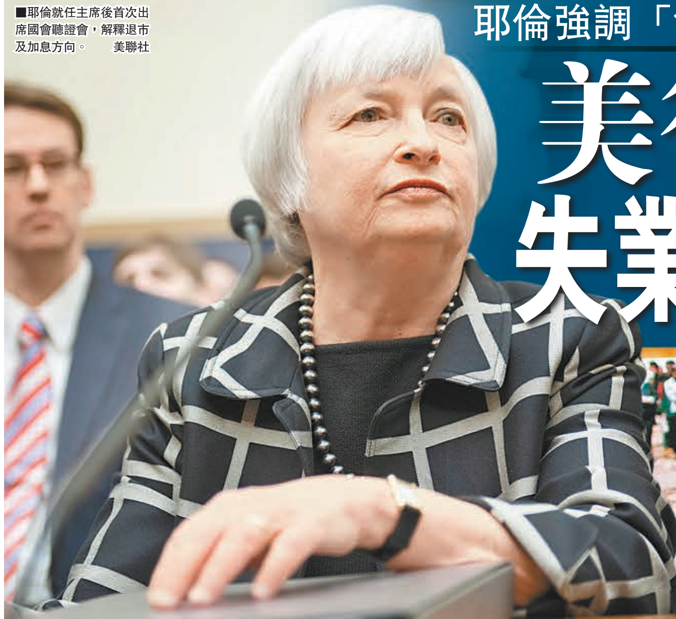
即使失業率跌至遠低於 6.5%，聯儲局亦不會即時加息。圖為招聘會。

美國聯儲局主席耶倫昨日出席上任後首次國會議證會，發表為量化寬鬆辯護的「鴿派」講辭。她強調聯儲局會維持政策延續性，個人非常支持前任主席伯南克的處理手法，若經濟持續改善，局方會循序漸進減少買債，但同時表示不會事先設定退市步伐，而是依經濟前景評估而行事。她稱，即使失業率跌至遠低於 6.5%，聯儲局亦不會即時加息，言論帶動美股昨中段升 140 點。