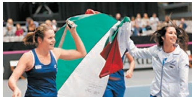
■衛冕冠軍意大利慶祝勝利。美聯社

新華社華盛頓9日電 2014年聯合會盃女子網球團體賽世界一組9日已經產生了4強中的3支球隊，衛冕冠軍意大利、德國和澳洲均已提前鎖定準決賽名額。