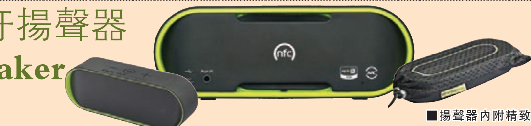
■它支援 NFC 配對，只需把手機放到背面的感應器，便可以配對及播放，簡單直接地聆聽動人的音樂，同時配合未有藍牙連接的器材，也配備 3.5mm Aux-in。

它採用 2.1 單元的結構，前方為兩個 1 吋單元，而被動式低音單元位於後方，聲音飽滿結實，在清晰的人聲及樂器以外，還有強勁的低頻，選用 Class D 放大器，高效率而省電，因此充電 2 小時後，便能用上高達 10 小時，一整天在戶外使用也沒有問題，隨處也能享受 2.1 帶來的樂趣。藍牙方面為 3.0 規格，對應 aptX 編碼技術，大大減少藍