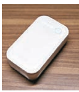
■D.qual Powerware 5000 Freedom 備有雙 USB 埠 (1.0A + 2.5A) 可為兩部智能裝置同時進行充電，更將支援「Qi」的智能裝置放於流動電源上方進行無線充電。(HK$388)

充電。只要智能裝置支持無線充電，就可以直接放在 Powerware 5000 Freedom 上方進行充電，繼續與另一半綿綿細語。至於一般智能裝置，同樣可以經過電池內置的兩個最高合共 3.5A 的輸出充電。兩個 USB 埠中間更設有 LED 手電筒，長按電源按鈕隨時為另一半作明燈導航。