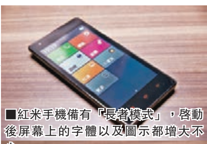
■紅米手機備有「長者模式」，啟動後屏幕上的字體以及圖示都增大不少。

Whatsapp、Line 等即時通信軟件是與最愛保持聯繫的重要渠道，如果不需要追潮流買最新、最快智能電話的話，最近大熱的紅米手機也許是一個好選擇。先不說紅米手機以非常相宜的售價 HK$999 發售，更備有用特大圖示及字體的「長者模式」，就算是「老友記」送給另一半，有「老花」的話都可以輕鬆看到、用到所有功能。它還備有 MT6589T 1.5GHz 四核心處理器、1GB RAM 以及 4.5 吋 720p 熒幕，以一般用家使用智能手機瀏覽網頁、Whatsapp 聊天等基本功能來說已經完全足夠。如果大家未能透過銷售紅米的「小米網站」成功搶購的話，你可以透過剛成為了全港首家紅米手機的經銷商 PCCW HKT 購買紅米，你只要簽下 12 個月服務計劃，就可以以最低 148 元月費（另加 38 元增值服務）將手機帶回家，以及得到每月由 1GB 起的流動數據，還有 3 個月 WeChat 數據組合和 10GB uHub 雲端儲存，不失為轉台好選擇。