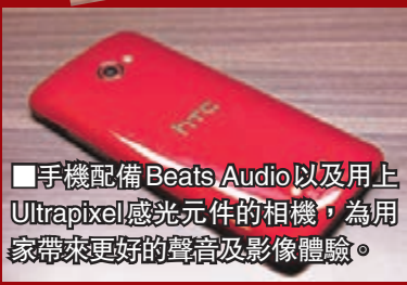
■手機配備 Beats Audio 以及用上 Ultrapixel 感光元件的相機，為用戶帶來更好的聲音及影像體驗。