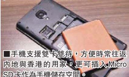
■手機支援雙卡雙待，方便時常往返內地與香港的用家，更可插入 Micro SD 卡作為手機儲存空間。