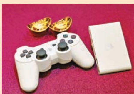
■配備 DUALSHOCK 3 無線控制器的「PS Vita TV Value Pack」套裝

Sony Computer Entertainment Hong Kong Limited (下稱 SCEH) 早前宣布最新最細的 PlayStation 娛樂主機 PlayStation Vita TV (PS Vita TV) 已登陸香港，售價為 HK$798，同時亦將推出包括 DUALSHOCK 3 無線控制器的「PS Vita TV Value Pack」套裝，售價則為 HK$1,180。而且，還於 3 月 31 日前，SCEH 與和記環球電訊旗下 3 家居寬頻合作推出「全家速 Wi-Fi 玩樂方案」月費計劃，大家只要登記 3 家居寬頻的「全家速 Wi-Fi 玩樂方案」HK$188 月費 100M 寬頻服務或 HK$228 月費 1G 寬頻服務計劃，即可獲 PS Vita TV Value Pack 乙套 (價