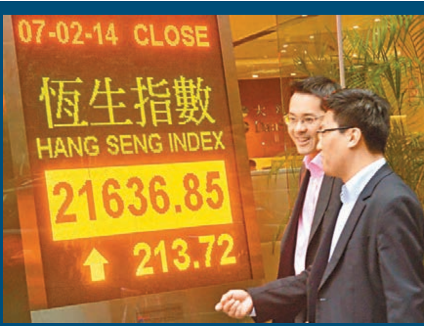
■港股昨再升213點,全周計則下跌1.8%。

個別股份方面,停牌逾兩年,昨日復牌的伯明翰(2309)遭洗倉,股價勁瀉34.42%至0.101元,成交達1.32億元。中信21(241)連瀉兩日後,淡友繼續「空襲」,收市再跌6.1%,較當日高位已蒸發逾半升幅。