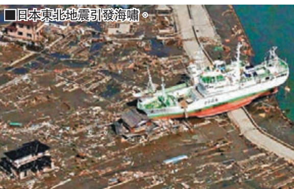
日本東北地震引發海嘯。

皮林認為，這個答案可從日本的歷史中尋獲。數百年來，日本處於鎖國狀態，堅守日人純種社會。日本現時的一億二千七百萬人口當中，僅得二百萬外族人(大部分屬韓國人)。日本排外的另一個原因，是在一九一九年的巴黎和會上，日本要求在國際聯盟章程中加入「種族平等」條款，但遭歐美列