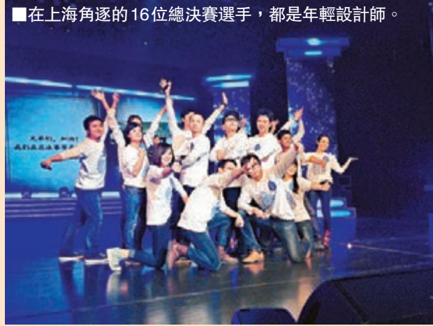
在上海角逐的16位總決賽選手，都是年輕設計師。