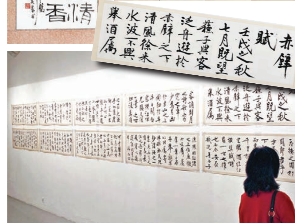
《赤壁賦》全文壯闊波瀾，引來觀眾駐足觀賞。