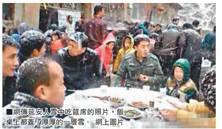
網傳延安人雪中吃筵席的照片,飯桌上都蓋了厚厚的一層雪。

有網友日前在微博上發佈了一張在陝西省延安吃「八碗」(當地對筵席的稱呼)的照片,照片上,人們圍坐在院子裡吃筵席,頭上、飯桌上都蓋上了厚厚的一層雪。網友轉發圖片並評論:延安人民用生命在吃八碗!