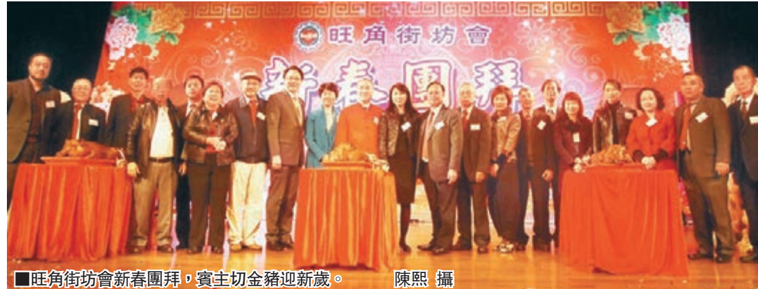
旺角街坊會新春團拜,賓主切金豬迎新歲。

香港文匯報訊(記者 陳熙)旺角街坊會年初七舉行甲午年新春團拜,各界歡聚一堂,共賀馬年新春。