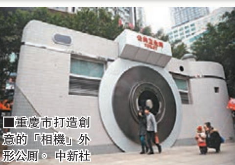
重慶市打造創意的「相機」外形公廁。中新社

香港文匯報訊(記者 孟冰 重慶報道)重慶市九龍坡區斥資千萬元打造的「創意公廁」前日已全面向市民開放,估計將惠及逾20萬市民。該系列的「創意公廁」分別有動物園、變壓器、電腦、相機、坦克等造型,甚至在「相機」公廁中,還分有單反和卡片機兩種造型。