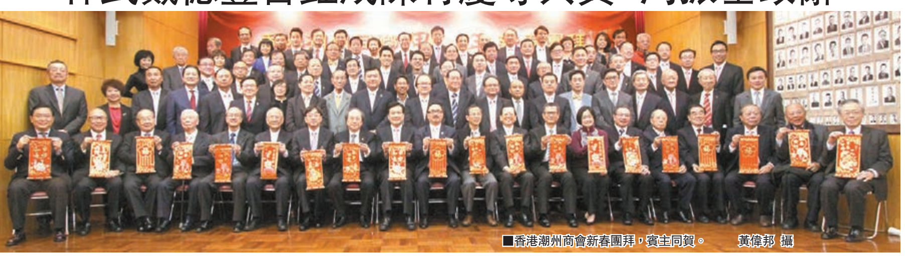
香港潮州商會新春團拜,賓主同賀。