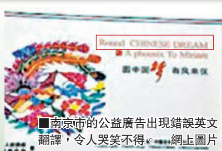
南京市的公益廣告出現錯誤英文翻譯,令人哭笑不得。網上圖片

江蘇省南京市一處街頭公益廣告因為照中文直譯英文而鬧出笑話,網民戲稱為「神翻譯」,其中「圓中國夢」(正確寫法:「make Chinese dream come true」)譯成「round Chinese dream」(意思是「圓圓的夢」)。