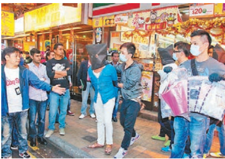
在尖沙咀樂道毒窟被捕南亞裔毒販。

油尖警區特別職務隊人員早前根據線報經深入調查後，昨日下午約2時採取行動，突擊搜查尖沙咀樂道23號一單位，檢獲約90克懷疑大麻精、約40克懷疑大麻花、少量懷疑可卡因及一批毒品包裝工具，全部毒品市值