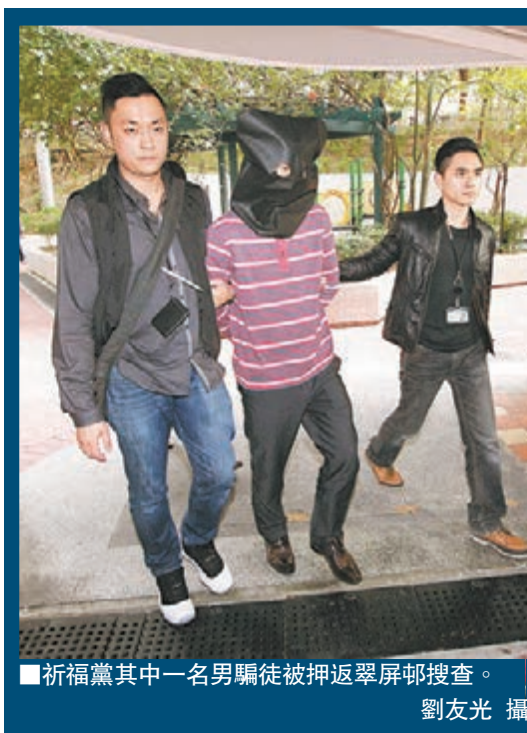
祈福黨其中一名男騙徒被押返翠屏邨搜查。

昨日下午3時半，觀塘警區重案組第一隊探員將其中一名疑犯押返翠屏南邨翠榮樓一單位調查，逗留約半小時後離去。