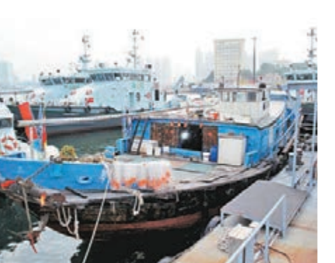
涉走私未完稅香煙及電油來港的漁船。