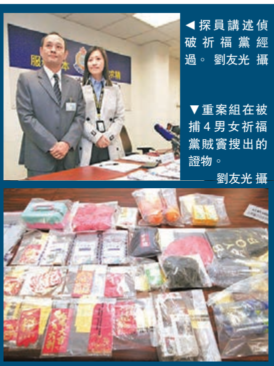
探員講述偵破祈福黨經過。