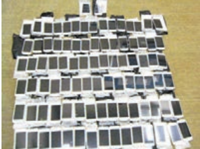
海關在深洲灣管制站檢獲92部走私手提電話。

香港文匯報訊 香港海關日前在深洲灣管制站偵破1宗涉嫌利用出境車輛走私手提電話案件，檢獲92部新型手提電話，總值約51萬元，並拘捕1名56歲男子。