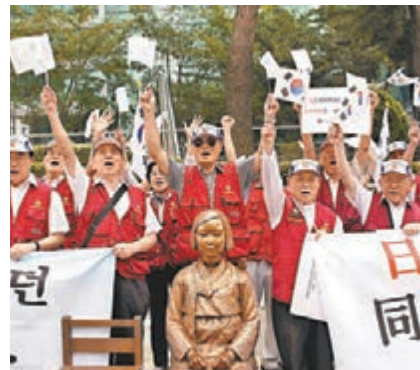
日本多次在慰安婦問題上大放厥詞，引起韓國民眾去年在日本使館外抗議。資料圖片

日本政府多次在慰安婦問題上大放厥詞，引起鄰國不滿。據報日方聘用美國公關公司，就慰安婦問題展開公關活動，並密切注意美國輿論動向。美國《國會山莊報》前日報道，最少兩家華盛頓公司替日本政府密切注視有關問題，收集美國本土廣告、各州立法等有關慰安婦問題的動態。根據美國司法部紀錄，日本政府在昨年9月至去年8月間，向Hogan Lovells及Hecht Spencer公司，分別支付逾52.3萬及19.5萬美元(約406萬及151萬港元)報酬。