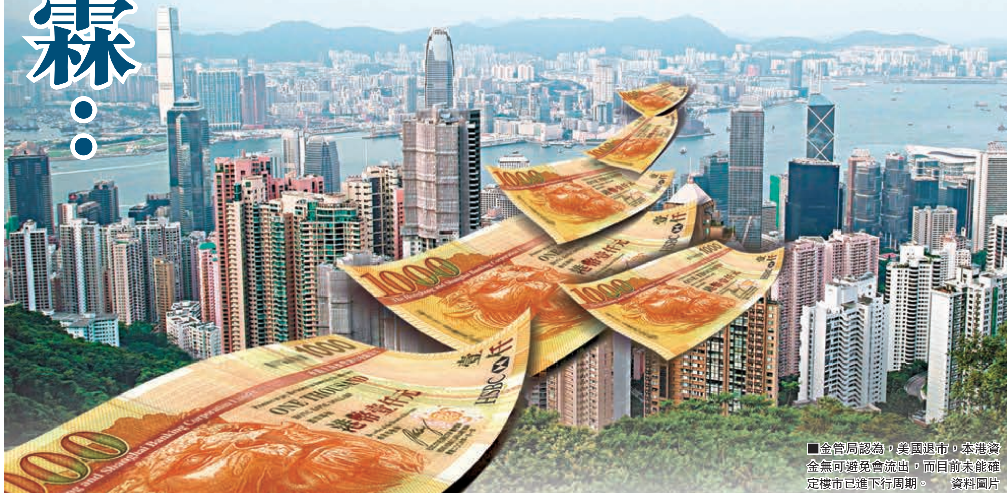
■金管局認為，美國退市，本港資金無可避免會流出，而目前未能確定樓市已進下行周期。