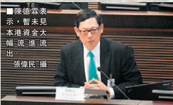
■陳德霖表示，暫未見本港資金大幅流進流出。

談及美國經濟情況，陳德霖指，當地貨幣政策正常化的過程已經展開，經濟增長趨勢良好，去年12月失業率下降1.2個百分點至6.7%，房屋市場按年增長16%，個人消費亦增長3.3%。美國聯儲局預期經濟增長加快，失業率將持續下降，預測今年美國經濟增長