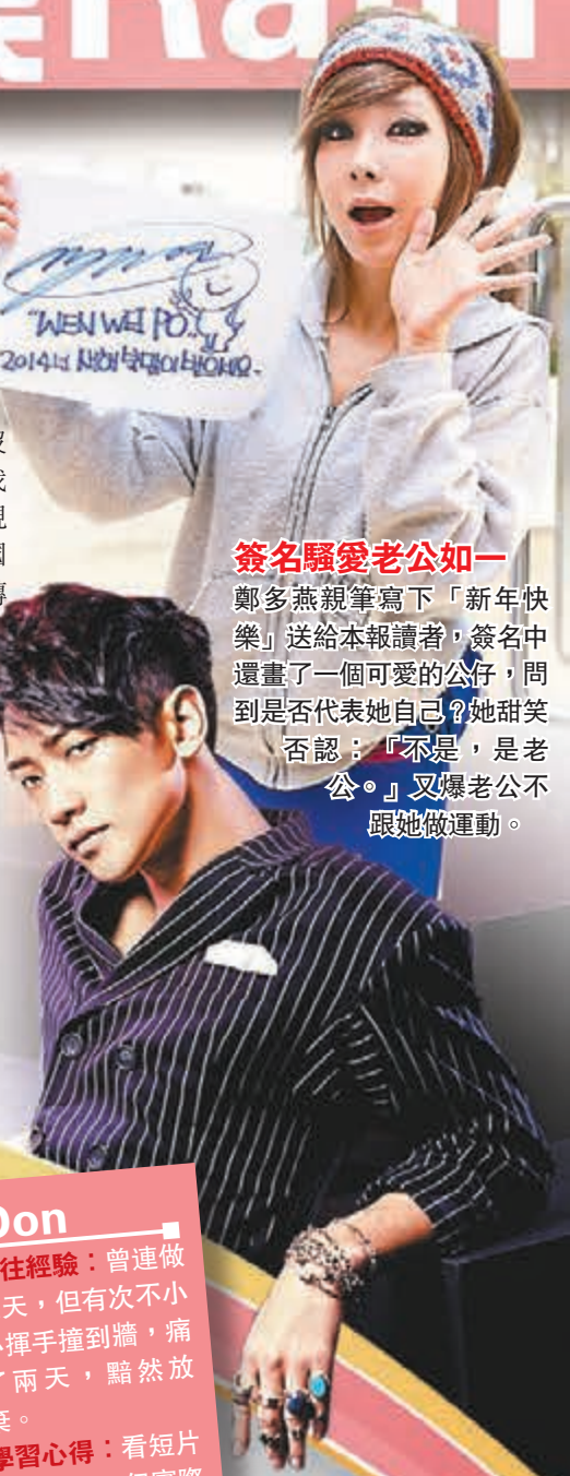
簽名驕愛老公如一 鄭多燕親筆寫下「新年快樂」送給本報讀者，簽名中還畫了一個可愛的公仔，問到是否代表她自己？她甜笑否認：「不是，是老公。」又爆老公不跟她做運動。