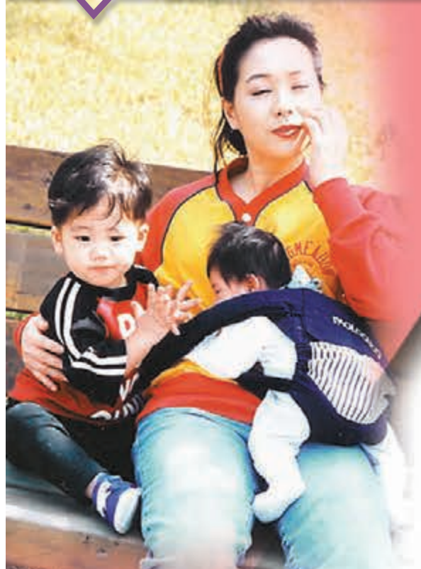
■鄭多燕曾因產子兼懶做運動而暴肥。

香港文匯報訊 韓國「塑身女王」鄭多燕上月來港拍攝廣告，以及5月在港舉行的大型健康舞騷的宣傳照，雖然她行程繁密，但仍抽空向本報讀者拜年，又教三位星級粉絲糖妹、享樂團主音Don(伍浩然)及王若琪(Takki)跳其自創的塑身操(Figure Robics)，大讚糖妹跳得最好。她謂最希望將塑身操發揚光大至歐美等地，令當地人都跟她跳，為亞洲人爭光。她又稱讚韓國男藝人中，韓流天王Rain的身材最好，想摸吓對方添！