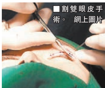
割雙眼皮手術。

時值春節假期,內地一些醫院美容整形科吸引了大批學生,更有甚者首飾店竟變成了兼職醫院,吸引不少學生前來穿耳洞。在瀋陽南行文化用品市場,上述店舖不僅可以穿耳洞、鼻環、臍環、唇環、舌環等都被納入經營範圍。據悉,有些家長更帶只有八、九歲的孩子到醫院割雙眼皮。