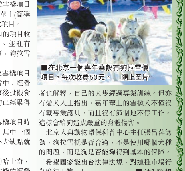
在北京一個嘉年華設有狗拉雪橇項目,每次收費50元。

四隻狗拉着遊客,馳騁在雪地上。近日,曾備受爭議的狗拉雪橇項目又出現在工體歡樂冰雪嘉年華上(簡稱工體嘉年華),愛犬人士呼籲取消此項目。5日上午9點,在工體嘉年華門口的項目收費表中,「狗拉雪橇」赫然在列。並註有「另收費」字樣。工作人員也證實,狗拉雪橇每50元一次。粗略計算,在5分鐘左右,狗拉雪橇項目就吸引了三撥遊客嘗試。而在這當中,經營者並未更換犬隻,只是在每圈結束後投餵食物以作「獎勵」。但同時,有的狗已經累得趴在在了地上。