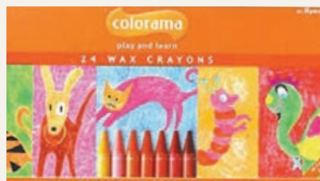
Hindustan 蠟筆顏色標籤歧視印度人膚色。

印度一間大型文具生產商推出彩色蠟筆，粉紅色的一枝被標籤為「皮膚顏色」。當地有大學生稱感到受傷害，指生產商涉嫌種族歧視，入稟法院索償 10 萬英鎊(約 126 萬港元)。