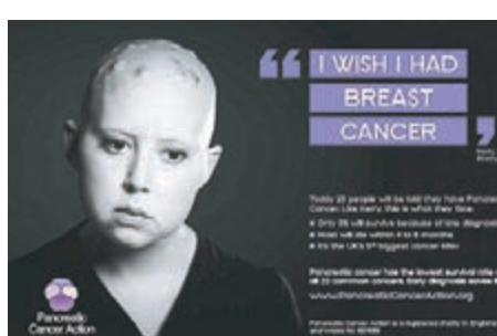
廣告以「我希望有乳癌」為宣傳口號。

英國一個關注胰腺癌的慈善機構推出的電視廣告引起非議，片中一名女患者稱：「我希望有乳癌」，帶出胰腺癌死亡率遠高於 22 種常見癌症的訊息。廣告播出後引起外界猛烈抨擊，稱廣告將各種癌症作比較是麻木不仁及令人反感。