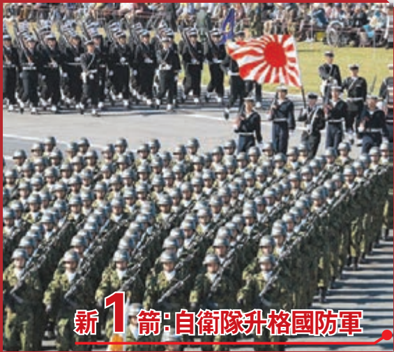
新1箭：自衛隊升格國防軍

香港文匯報訊（記者 葛沖 北京報道）新年伊始，日本首相安倍晉三小動作不斷，向危險道路上愈行愈遠。在過去短短兩天間，日媒密集披露日本政府三道動作。日本首相安倍晉三前日公開宣稱將修改憲法第9條意願，提出創設國防軍；日本政府亦於同日公布擬在小學教科書寫入對釣魚島所謂「主權」；昨日又傳出日美今夏將舉行聯合奪島演習，陸上自衛隊首次參演消息。專家提醒，中國既要在國際上加大揭批日本的力度，同時也要防範日本未來搞突襲，要軍事上有備無患。