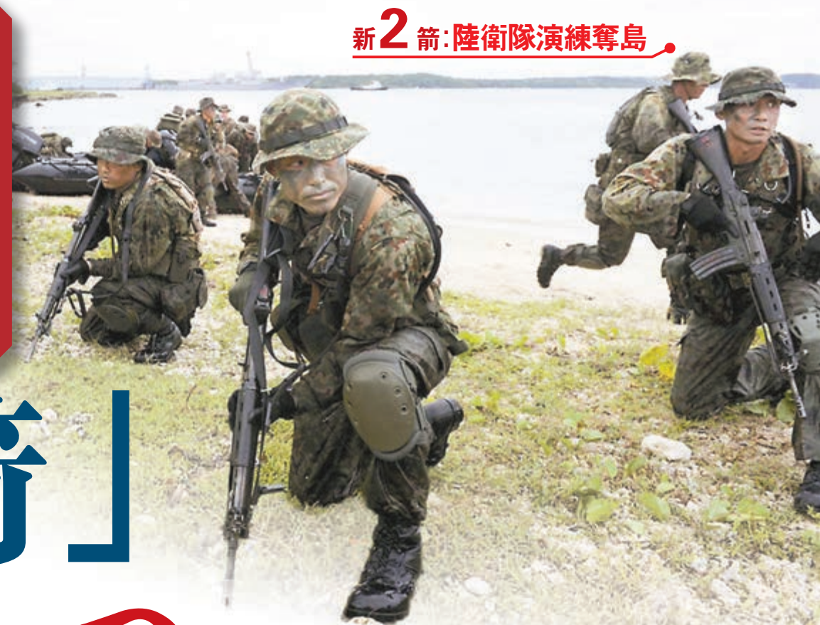
新2箭：陸衛隊演練奪島