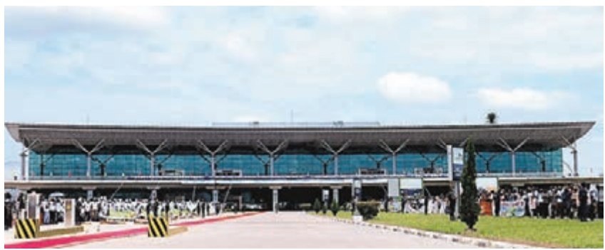
■剛果(布)首都布拉柴維爾機場新航站樓。