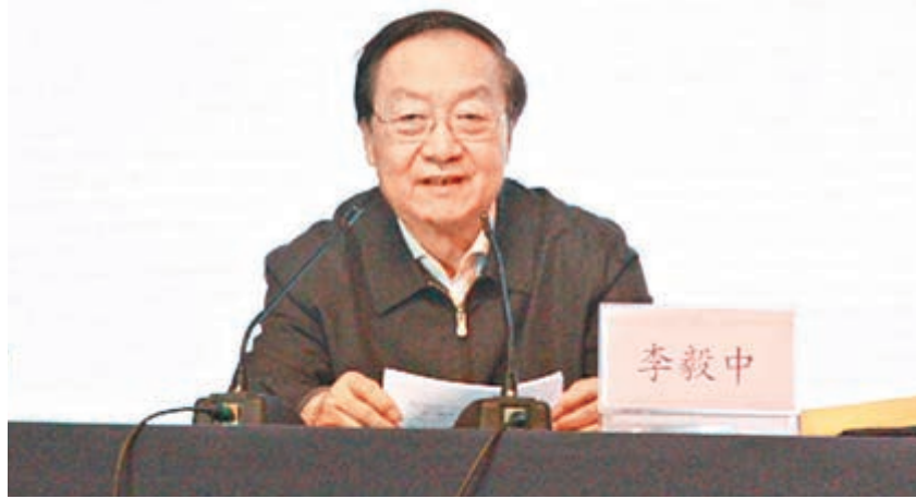
■全國政協常委、經濟委員會副主任李毅中認為，實體經濟利潤率下滑，工業出現「空心化」。

因為產能過剩，日本曾經歷20多年經濟蕭條。縱觀中國整體企業，自2012年起，產能過剩問題逐漸暴露加重，生產成本也升高，造成經濟發展趨於停滯，通貨膨脹率居高不下。為