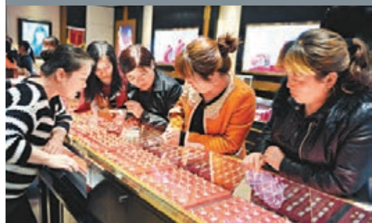
■上海金店銀樓的金價早在去年8月便不再統一，春節期間更現「價格戰」。

香港文匯報訊（記者 錢修遠 上海報導）上海金店銀樓的金價早在去年8月受到反壟斷處罰後便不再統一，春節期間更是出現了「價格戰」。據了解，雖然老鳳祥、老廟黃金等上海老牌金店的金飾價格依然統一，但在上海的金飾品界中已出現了每克288元（人民幣，下同）的最低價。據悉，滬上金店傳統的銷售方法中，黃金飾品的原料價格一般都是在國際金價的基礎上，加價