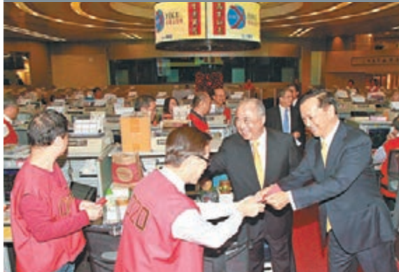
■馬年首日開市，港交所主席周松崗(右二)及行政總裁李小加(右一)齊齊大派利是。

香港文匯報訊（記者 周紹基）港股馬年首日開市雖然下挫，但港交所(0388)主席周松崗表示，「馬」代表活力、速度及耐力，有助帶動香港金融市場未來發展。他續指，港交所會積極發展新業務，發展更會是全方位，今年會積極研究各地綜合性交易產品，例如前年收購倫敦金屬交易所(LME)等，可望繼續確保香港國際金融中心地位。港交所行政總裁李小加昨補充說，今年該所會繼續研究推出各類金融產品，現時已有考慮及進行很多準備的工作，但由於推出程序困難，無論是LME或其他產品都一樣，所以未來會研究結合外地的交易所，搭配國際市場、LME，以及內地產品交叉上市及交易。至於新股市場方面，李小加認為，現時只是年初，談論全年的新股集資情況是太早，但他笑言一直保持