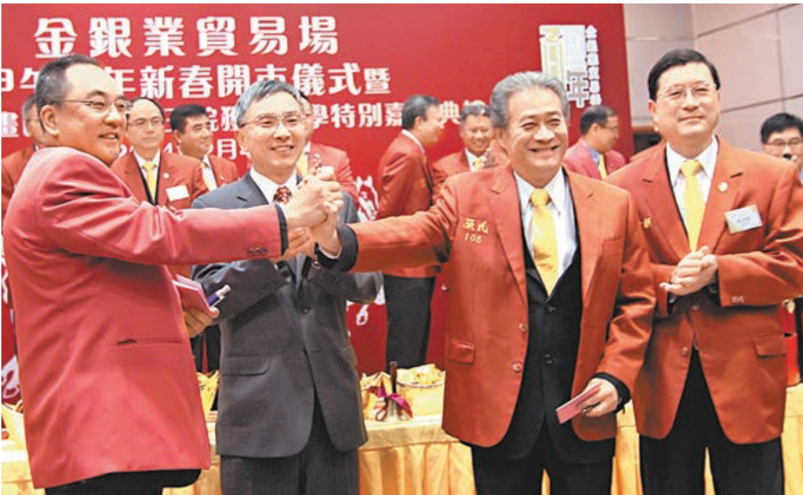
■香港特區政府財經事務及庫務局副局長劉怡翔(左二)見證金銀業貿易場第一口價。

金銀業貿易場計劃在深圳前海建立黃金白銀交易平台，張德熙表示，金銀業貿易場非常關注前海商機，