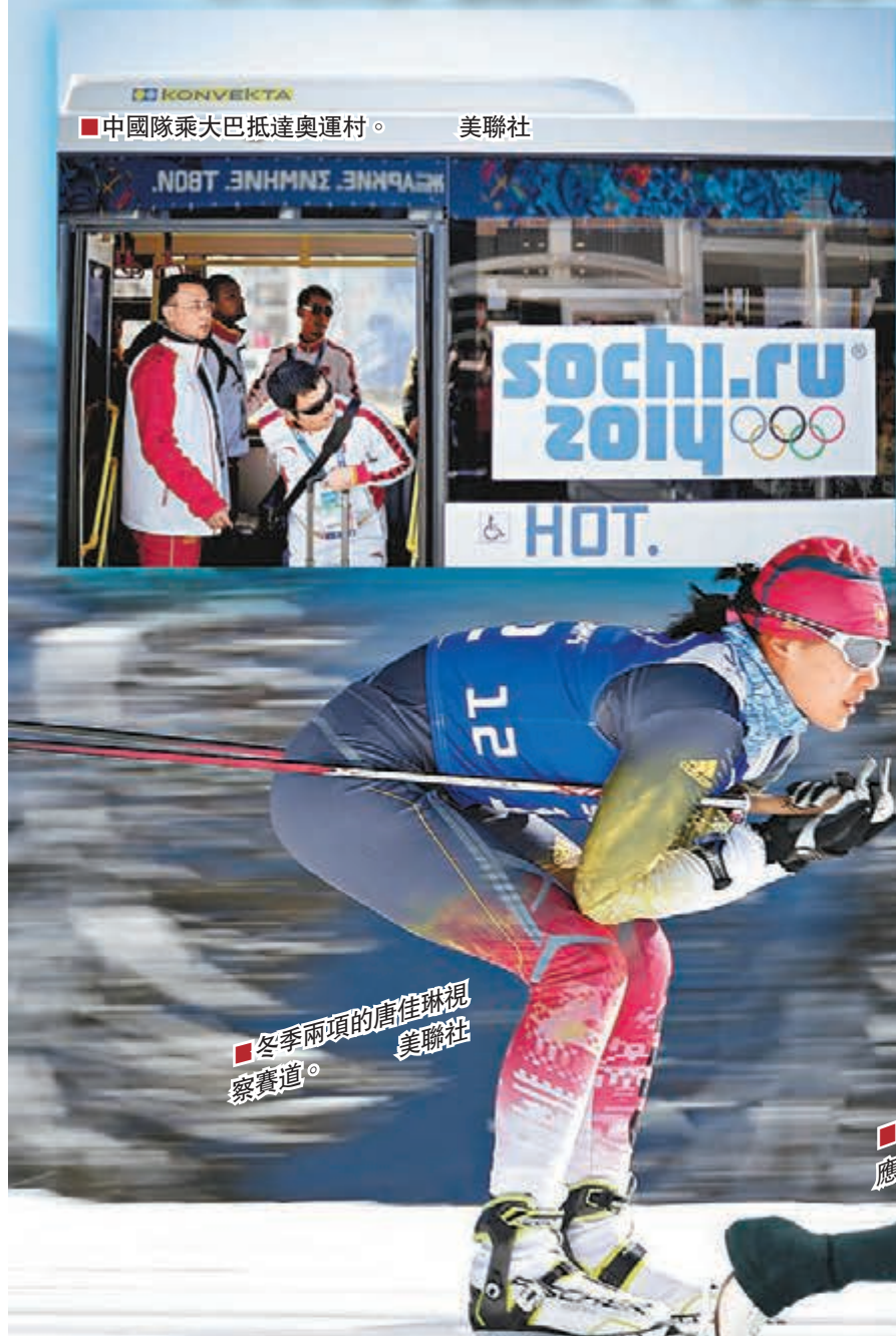
中國隊乘大巴抵達奧運村。