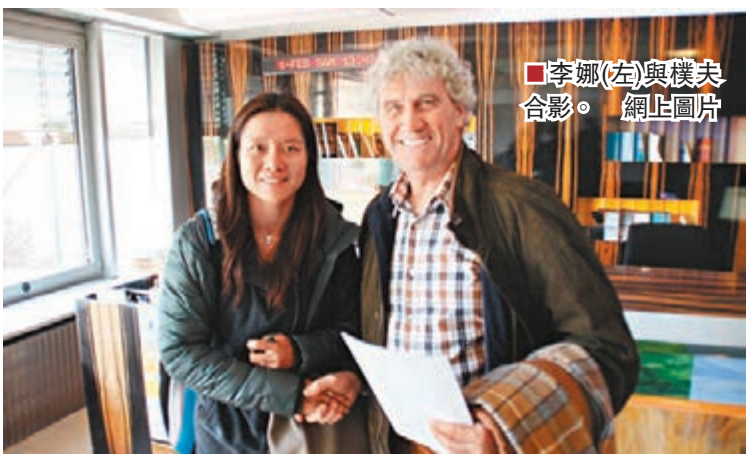
李娜(左)與樸夫合影。

李娜在上月的澳洲網球公開賽過關斬將，一舉奪得職業生涯第二個大滿貫錦標，其成就讓國人歡欣鼓舞。不過，「李娜回國全程黑臉見恩師」、「手提12萬豪包對湖北省政府80萬獎勵」、「摺掌門」等報道……，在內地引起軒然大波，不少家鄉傳媒怒目橫眉，力責李娜不知恩圖報。