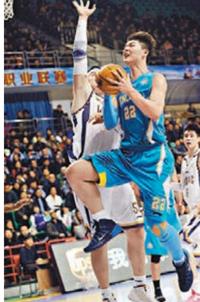
王哲林(藍衫)在CBA聯賽中表現出眾。資料圖片

2009年的天津亞錦賽開始，經歷2010年的廣州亞運會和土耳其世錦賽，到2011年的武漢亞錦賽，再到2012年倫敦奧運會和2013年菲律賓亞錦賽的慘敗。五年裡，我們數次錯過為國家隊注入新鮮血液、完成新老交替的機會，王哲林、丁彥雨航等一批年輕球員不經受國際強隊衝擊的考驗，不感受世界籃球思維的洗禮，又怎能接過王治郅等人手中的大旗。官方說法，中國籃協放棄外卡的理由主要有兩點，一是着力備戰亞運會難以兼顧世界盃，二是沒錢付外卡申請費。但是按照正常邏輯，是世界大賽重要還是洲際比賽重要？這裡亞運會之所以更重要，恐怕還是一切向金牌看齊的結果。至於那83萬歐元的外卡費，對於精明的贊助商、億萬熱愛籃球的球迷以及中國籃球的未來而言，應該算不上主要理由吧，畢竟世界盃是4年才有一次的機會。更何況，下屆世界盃外卡政策將取消，那時再想買票學習都沒有機會。