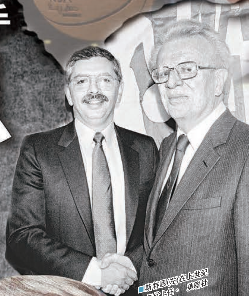
■斯特恩(右)在上世紀80年代上任。