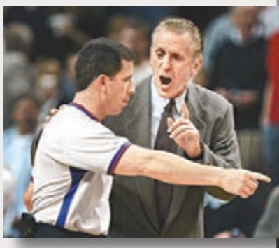
■多納吉(左)令NBA形象蒙污。

2007年夏天，美國聯邦調查局揭露資深裁判多納吉在此前的2個賽季中參與賭波，其中有些比賽還是他親自執法的比賽。多納吉因這一黑幕被判入獄15個月，在審判期間，多納吉多次爆料，包括「裁判、教練和球員間的關係左右着比賽結果」等，而斯特恩在各種場合反覆強調「相信多納吉是NBA唯一涉賭裁判」。雖然多納吉最終入獄收場，但這次醜聞還是影響NBA的聲譽。