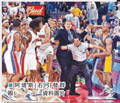
■阿堤斯(右)引發群毆。

2004年11月，活塞在主場和溜馬發生鬥毆事件，溜馬前鋒阿堤斯(現改名為慈愛世界和平)被一名球迷扔下的杯子砸中，隨後他衝上看台毆打該名球迷，場面一度失控。對於這宗惡劣事件，斯特恩簽署了NBA史上最嚴厲的一張罰單，共有9人被禁賽，總禁賽場次達到150場，阿堤斯被處以全季禁賽的重罰。