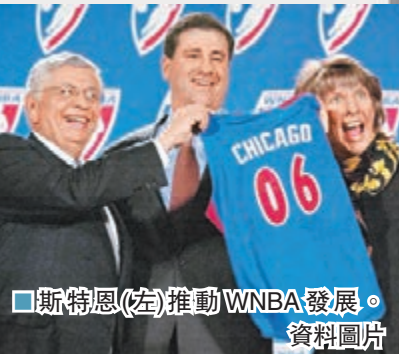
■斯特恩(左)推動WNBA發展。資料圖片

1997年，WNBA正式揭幕，首場比賽由紐約自由隊對洛杉磯火花隊，在歷經十餘年的發展後，WNBA已成為世界女子籃球最高殿堂。另外，同年帕勒莫和坎特納成為NBA歷史上首批女裁判。2001年，NBA創立NBA發展聯盟(NBDL)，現在已經成為NBA最重要的人才庫。