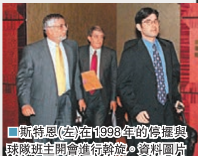
■斯特恩(左)在1998年的停擺與球隊班主開會進行斡旋。

1998年和2011年，NBA因為勞資談判陷入僵局而兩次停擺。1998年的停擺時間長達464天，當年的常規賽被迫縮減為50場。2011年，停擺風波再度襲來，這次停擺時間為161天，常規賽縮減到66場。停擺風波造成NBA數以億計的財富流失，不僅造成相關產業的失業潮，也嚴重降低球迷和媒體對於NBA和斯特恩的印象分。