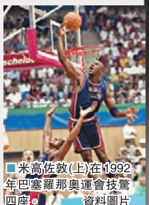
■米高佐敦(上)在1992年巴塞羅那奧運會技驚四座。

在1988年奧運會遭遇滑鐵盧後，NBA在1992年派出由「魔術手」莊遜、「小鳥」布特、佐敦等超級球星組成的美國男籃征戰巴塞羅那奧運會，這支被稱為「史上最強」的男籃在巴塞羅那所向披靡，平均每場贏下對手超過40分，主教練戴利甚至沒有叫過一次暫停。「夢之隊」在奧運會上的一炮而紅，極速擴大NBA的影響力，為NBA此後大刀闊斧的國際化注入一針強心劑。