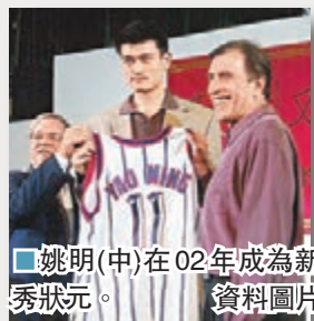
■姚明(中)在02年成為新秀狀元。資料圖片

中國中鋒姚明在2002年以「狀元」身份加盟火箭，並逐漸成長為全明星級別的球星，也為NBA與中國之間架起一座橋樑。NBA在中國的影響力也因為姚明的存在而極大擴張，NBA中國賽就是其中一例。2004年，火箭與帝王在北京和上海參加首屆NBA中國賽，NBA也成為首個在中國舉辦正式比賽的美國職業體育聯盟。