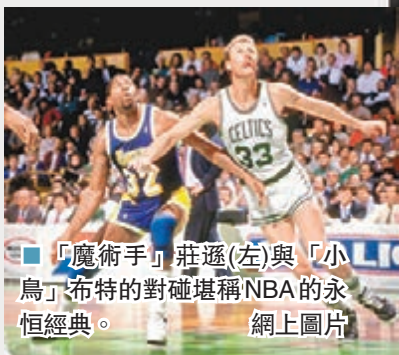
■「魔術手」莊遜(左)與「小鳥」布特的對碰堪稱NBA的永恒經典。

上世紀80年代，斯特恩上任僅4個月，NBA總決賽在塞爾特人和湖人之間上演，這也是「小鳥」布特與「魔術手」莊遜在總決賽的首次相遇，這場對抗拉開了綿延上世紀80年代「黑白雙煞」時代的序幕，雙方此後又在總決賽2次相遇，締造了NBA歷史上最為引人關注的一組對決。