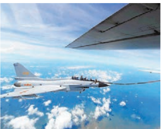
中國戰機不時成為西方間諜竊取情報的目標。圖為殲-10進行空中加油。

像喝了迷魂藥而飄飄然，毫無警惕、滔滔不絕對日本「學者」作起「講座」，洩漏了國家重要機密，也斷送了自己的前程。西方對華科技、專利發明的竊取活動，手段先進、花樣百出，且不顧一切後果。部分黑手名義上是與研究機關合作，目的是竊取秘密。他們曾在贊助的先進儀器裡面安裝了竊密器；中國從西方購入的民用客機上，也曾經發現被安裝了令人難以發覺的竊聽裝置；中國至美洲橫跨太平洋的光纜被安裝「竊聽器」等駭人聽聞的例子。2007年，中國成功利用導彈擊毀試驗衛星，在西方世界引起強烈震撼。以美國為首的西方國家在經濟不景氣的情況下，仍然撥出巨資，培養科技間諜組織和人員「到中國訪問和活動」。