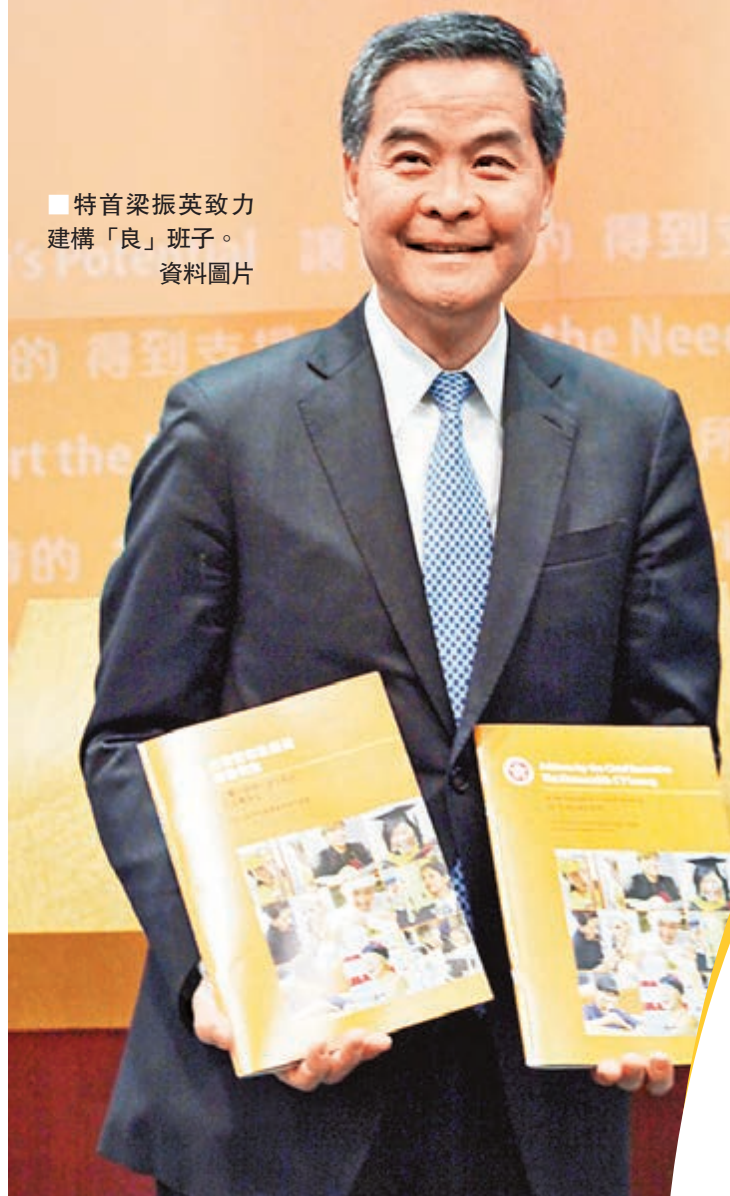
特首梁振英致力建構「良」班子。 資料圖片