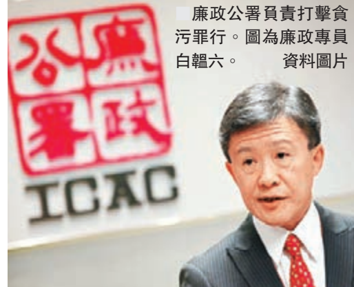
廉政公署負責打擊貪污罪行。圖為廉政專員白韜六。