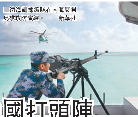
遠海訓練編隊在南海展開島礁攻防演練。新華社