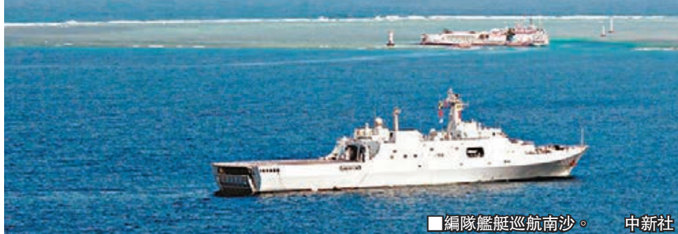
編隊艦艇巡航南沙。