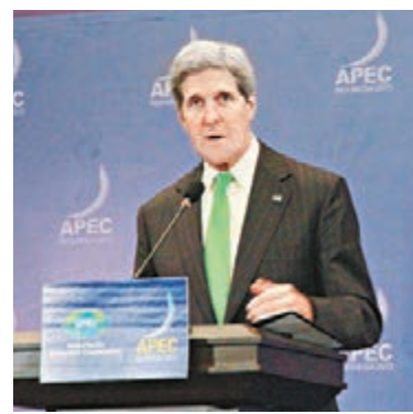
美國國務卿克里。資料圖片

倍」。 「來自美國的最後通牒，安倍政權瀕臨懸崖」，《日刊現代》25日以此為題發文稱，美國的警告雖然不是通過正式途徑傳達，但不容忽視。美國不否認該報道的真實性，讓人懷疑這可能是美方故意向媒體透露的信息。