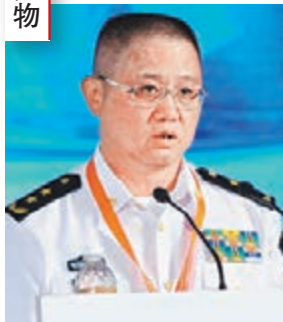
南海艦隊司令員蔣偉烈。

此次南海艦隊遠海訓練編隊的指揮員是南海艦隊司令員蔣偉烈海軍中將。資料顯示，蔣偉烈1955年出生，江蘇常州市武進人，現任廣州軍區副司令員兼海軍南海艦隊司令員。