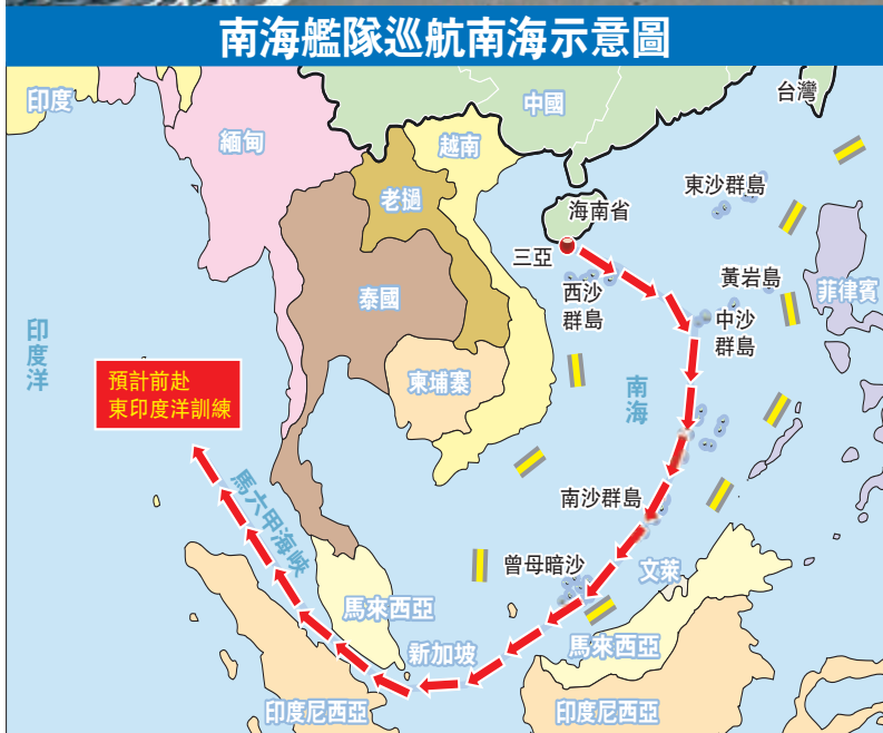
南海艦隊巡航南海示意圖