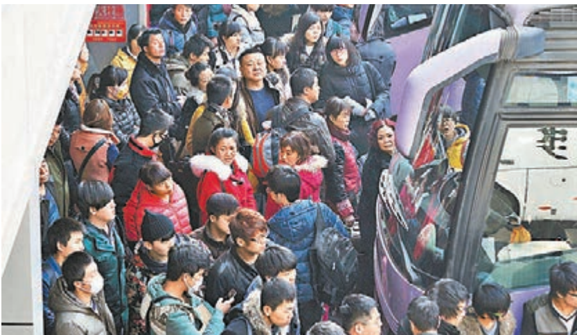
■鄭州各長途汽車站25日迎來客流高峰。

對於上述價格違法案件，發改委已責成當地價格主管部門依法予以嚴肅處理，責令退還多收旅客價款，並根據情節處以罰款。