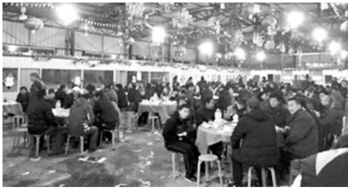
■村主任孫女滿月宴席上，坐滿了前來道賀的村民。

村民紛紛表示，踩河新村目前已被徵為規劃用地，未來全村可能會整體拆遷，為了能多拿點拆遷補償款，有好的落腳點，村民都想巴結好村委會領導。