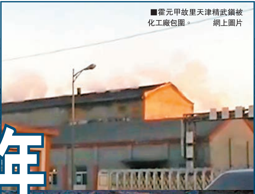
■霍元甲故里天津精武鎮被化工廠包圍。