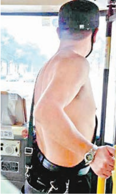
■武漢反常高溫21.8℃，巴士現「赤膊哥」。

氣象專家統計，新中國成立以來武漢同期日高溫在20℃以上的有4年，分別是1967年1月26日的20.9℃、1972年1月22日的24.2℃、1979年1月27日的21.4℃和1992年1月28日的20.1℃。