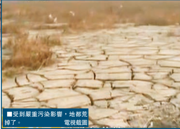
■受到嚴重污染影響，地都荒掉了。 電視截圖