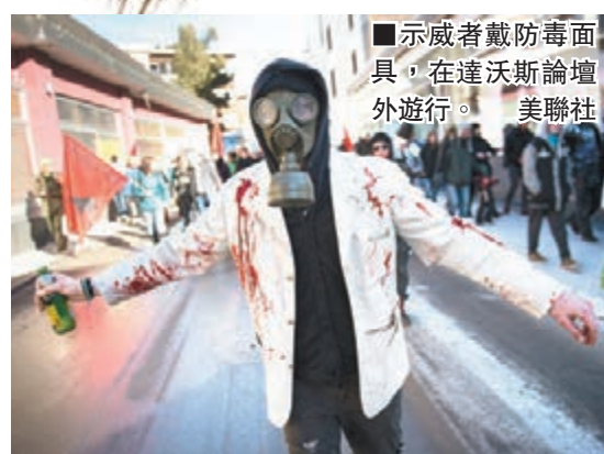
示威者戴防毒面具，在達沃斯論壇外遊行。