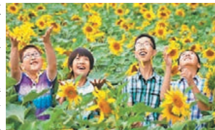
甘肅敬業農業科技園向日葵園區。本報蘭州傳真

據了解,甘肅鹽鹼地總面積為141.40萬公頃,鹽鹼耕地面積為32.25萬公頃,佔鹽鹼地總面積的22.81%。該企業將通過「企業化的人民公社」、「新