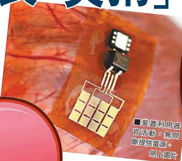
裝置利用器官活動，無間斷提供電源。

手機功能日新月異，但耗電量相應增加，用家愈來愈關注如何簡便地充電。由中國和美國研究人員組成的團隊，正研發一款植入人體器官的微型充電器，利用心臟等器官恆常活動產生的能量，未來有望出現「心跳充電手機」，屆時長煲電話粥也不怕無電了。