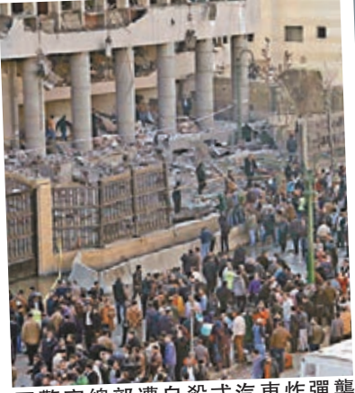
警察總部遭自殺式汽車炸彈襲擊，外牆損毀。