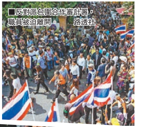
反對派包圍合作審計署，職員被迫離開。