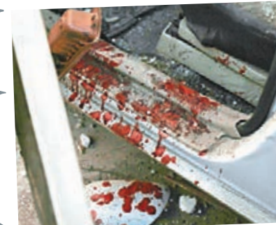
發動自殺式炸彈襲擊的汽車留下大片血跡。

今日為「茉莉花革命」蔓延至埃及3周年，在紀念日前夕，開羅及周邊地區昨發生3宗針對安全部門的爆炸襲擊，造成最少5死逾90傷，未有組織承認責任。開羅一間戲院之後亦發生炸彈襲擊，造成1死。