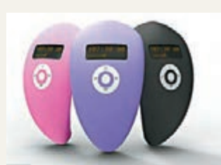
震動鬧鐘狀如彎曲iPod。

習慣賴床的女性有救了！市面有一款兼備性愛震動器用途的鬧鐘，只須每晚睡前放入褲內，選好震動模式，便可靜待早銷魂時刻。鬧鐘設計酷似彎曲的蘋果iPod，非常貼身，而且內置充電電池和配備多款插頭，去旅行也用得着。它在美、英、澳洲等地有售，價格約40英鎊(約517港元)。