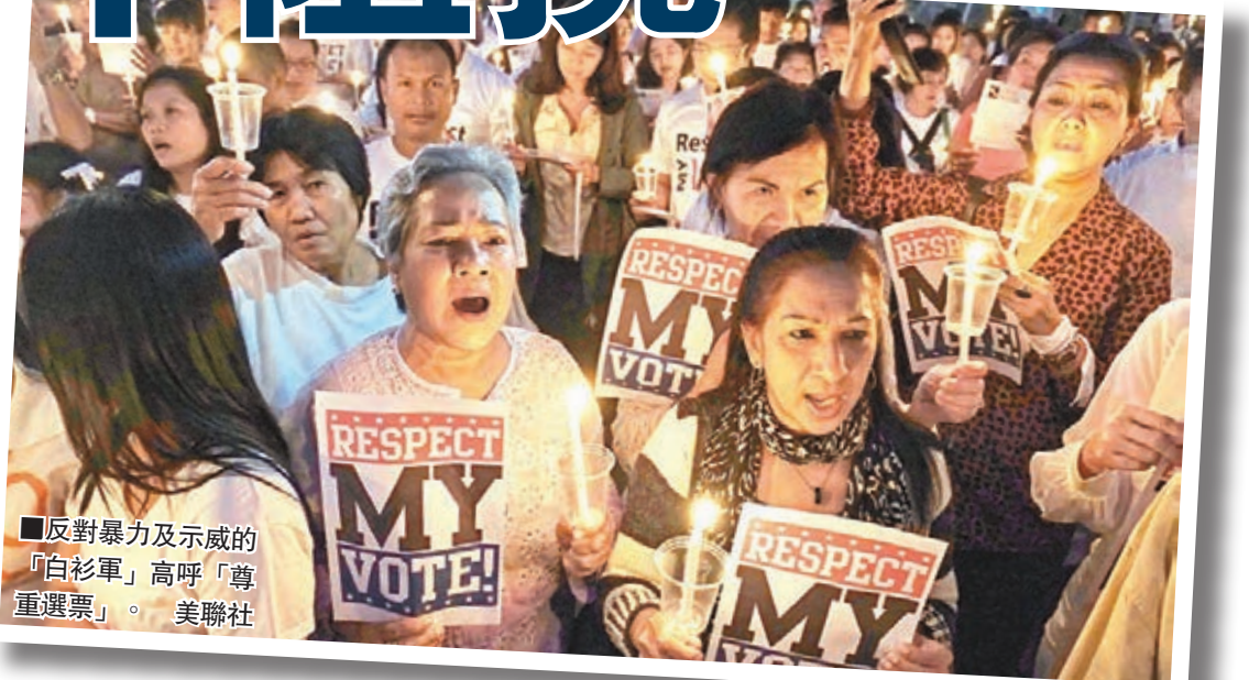
反對暴力及示威的「白衫軍」高呼「尊重選票」。