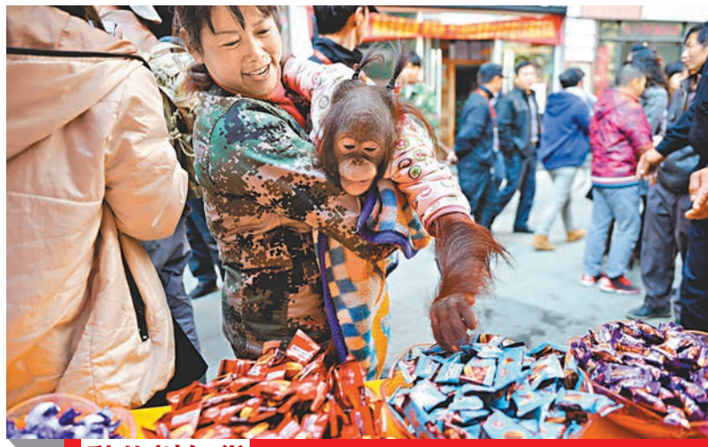
動物辦年貨 雲南野生動物園的動物明星昨日在飼養員的帶領下，來到昆明街頭的年貨街採購年貨。紅毛猩猩在挑選糖果，身背竹筐的羊駝則負責搬運，引來民眾圍觀。 中新社