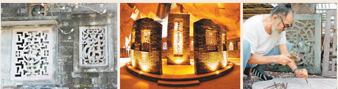
■傳統手工製石窗(右)比現代機器製 ■蛇蟠島石窗博物館已收集了不少明 ■現在手工製作石窗的傳人寥寥無幾了。

如今，這個油畫家成了三門石窗的保護人，在全國各地收集石窗。一扇普通的石窗，價格高達數千元。但梅軍還是不遺餘力地從全國各地把這些石窗搬回到蛇蟠島。他希望石窗能回到自己的家鄉得到最好的保護，更希望石窗這一非物質文化遺產能一直傳承下去。