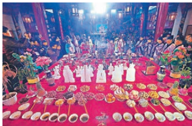
■祭禮凝結了楊氏人的心靈手巧。