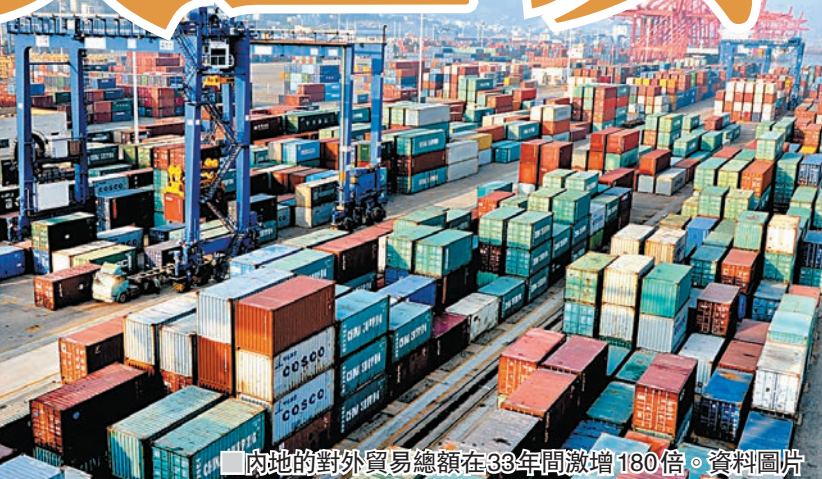
內地的對外貿易總額在33年間激增180倍。資料圖片