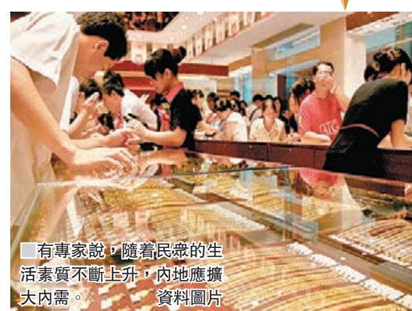
有專家說，隨着民衆的生活素質不斷上升，內地應擴大內需。