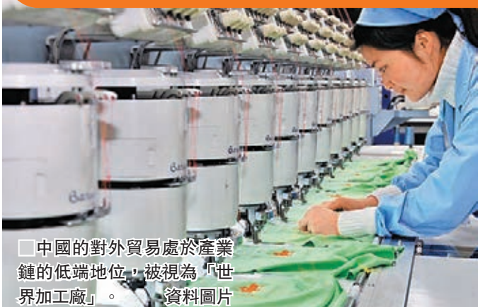
中國的對外貿易處於產業鏈的低端地位，被視為「世界加工廠」。 資料圖片