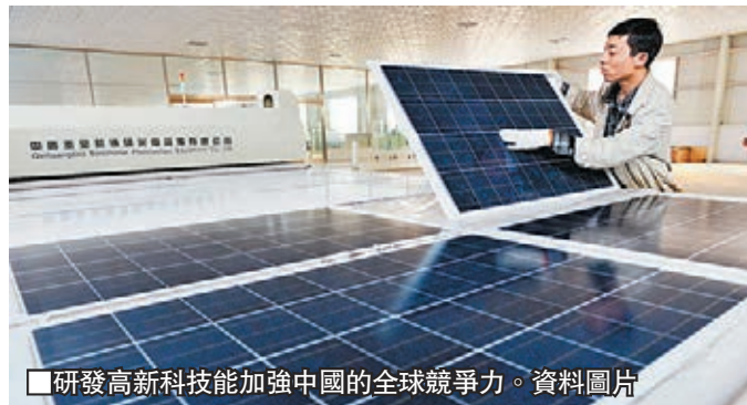
研發高新科技能加強中國的全球競爭力。資料圖片