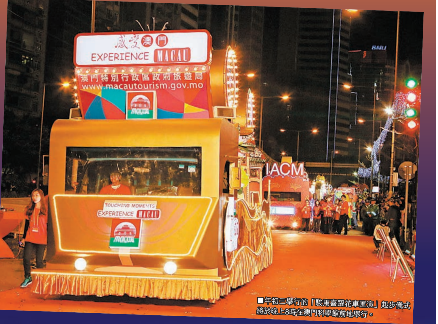
年初三舉行的「駿馬喜躍花車匯演」起步儀式將於晚上8時在澳門科學館前地舉行。