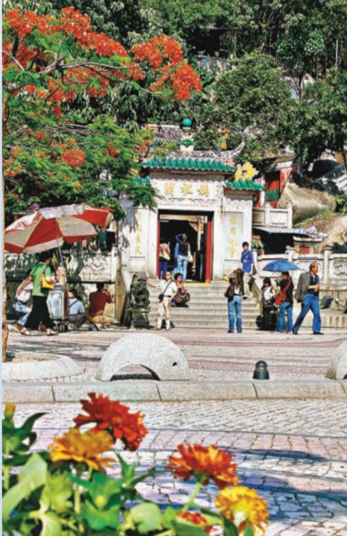
媽閣廟現為澳門三大古剎中最古老者，於2005年被列入世界文化遺產名錄內。