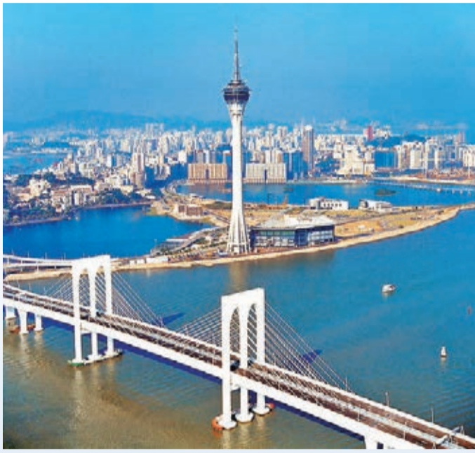
高338米的澳門旅遊塔是一個集美食、購物、娛樂於一身的休閒場所。