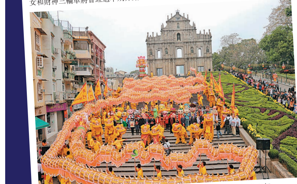
年初一，238米長的大金龍及18頭醒獅將從大三巴牌坊出發，巡遊拜年。

年初三至年初五（2月2日至4日）金童玉女、財神三輪車將沿着澳門四條《論區行賞》步行路線巡遊，向遊人拜年及派利是。每天上午10時30分開始，沿着「歷史足跡之旅」的路線，從南灣大馬路出發，於11時到達柯邦地前地（司打口）；11時15分由崗頂前地出發，沿着「中葡交匯之旅」在12時抵達澳門海事博物館；下午2時，金童玉女、財神三輪車巡遊將沿「綠色文創之旅」從西環湖廣場（觀音堂）出發，於3時15分抵達瘋堂斜巷（婁仔屋前）；下午3時45分至下午5時10分，金童玉女和財神三輪車將會經過本期介紹的「藝文探索之旅」路線。