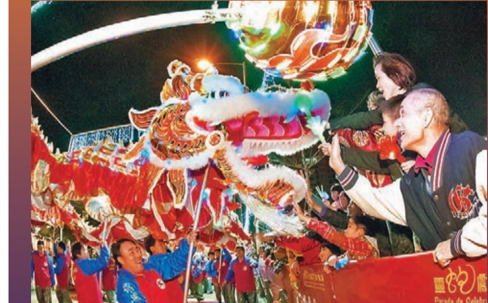
「駿馬喜躍花車匯演」今年除了23個本地團體沿途表演外，還邀請了8個外地表演團體參與。

今年的「駿馬喜躍耀濠江」賀歲活動除了有13部花車參與巡遊和23個本地團體沿途作文藝表演外，為了令活動更豐富、更具吸引力，還邀請了來自內地、香港、中國台灣、馬來西亞、日本、印尼、韓國和葡萄牙8個外地表演團體參與，表演者合共1,038人。其中，年初三舉行的「駿馬喜躍花車匯演」選取了今次介紹的旅遊步行路線「藝文探索之旅」的部分路線進行，在澳門科學館起步至西環湖廣場為終點，方便參與者沿岸觀看夜色及當晚的煙花表演。起步儀式將於晚上8時在澳門科學館前地舉行，經孫逸仙大馬路至旅遊塔前的西環湖廣場為終點。旅遊局將分別於科學館前、觀音蓮花苑前、澳門美高梅對開地段及西環湖廣場四個地點，讓表演團體停留表演。晚上8時45分，在西環湖廣場設有舞台表演，而巡遊隊伍在抵達西環湖廣場時，部分表演隊伍也會上台演出。煙花表演將於晚上10時進行。年初九舉行的「駿馬喜躍花車匯演」同樣有13部花車參與巡遊，由青洲大馬路出發，祐漢街市公園為終點，並安排舞台表演。參與「駿馬喜躍花車匯演」的13部花車將於2月3日至16日期間，分別在西環湖廣場及塔石廣場展出，花車的燈飾裝置於晚上7時至11時亮燈。