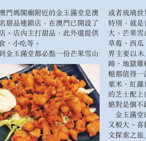
金玉滿堂的雞軟骨香脆有嚼勁，值得一試。

或者琉璃世界，其實這兩款甜品不上特別，就是普通的果果撈，但勝在分量大，芒果雪山主要的水果是芒果再加上草莓、西瓜、果凍、冰沙等，而琉璃世界主要以木瓜為主。其他的像wasabi豬蹄、地獄雞軟骨、芝士肉醬丁榴槿糯米糍都值得一試。芝士肉醬丁，肉醬配上粟米、紅蘿蔔，再蓋上一層芝士，濃濃的芝士配上肉醬，混合着麵條一起吃，絕對是個不錯的選擇。