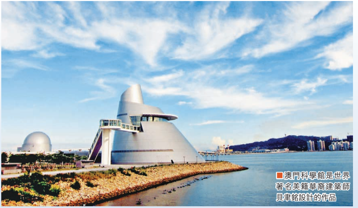
澳門科學館是世界著名建築師貝聿銘設計的作品

澳門藝術博物館毗連澳門文化中心，為澳門文化中心一個組成部分。澳門藝術博物館的館藏主要來自前買物博物館及歷年的徵集與購藏，重要館藏系列包括澳門黑沙考古出土的陶器及石器、明清廣東書畫、廣東名家篆刻、石灣陶瓷、澳門及鄰近地區出現的十九世紀西洋繪畫（歷史繪畫）、澳門