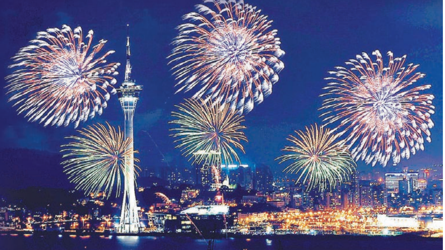
農曆年初三（2月2日）晚上10時進行的煙花表演將照亮澳門旅遊塔。