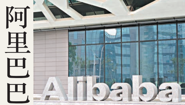
阿里巴巴成中信21世紀第一大股東。

逾100基點,但去年下半年市場氣氛已有所緩和。去年外匯基金支付予財政儲備費用為368億元,前年為378億元;另支付予特區政府基金及法定組織存款的費用為93億元,前年則為80億元。外匯基金累計盈餘在2013年增加134億元,總額達6,373億元。期內外匯基金總資產增加2,489億元至30,300億元,因負債證明書,銀行借貸,以及來自財政儲備、政府基金及法定組織存款增加。