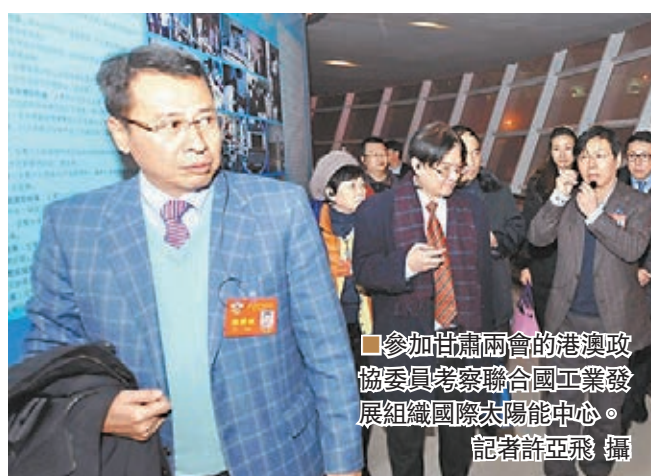
參加甘肅兩會的港澳政協委員考察聯合國工業發展組織國際太陽能中心。

香港文匯報·人民政協專刊訊(記者朱世強、肖剛蘭州報道)在日前舉行的政協甘肅省第十一屆委員會第二次會議上,來自港澳地區的21名政協委員踴躍議政,熱情獻策。他們除關注國家級蘭州新區、華夏文明傳承創新區、生態安全屏障綜合試驗區外,還對當地房價、物流業、教育、留守兒童、民營企業、人口老化等問題精心準備了提案和發言。港澳委員的「好聲音」引起兩會代表和媒體的關注。