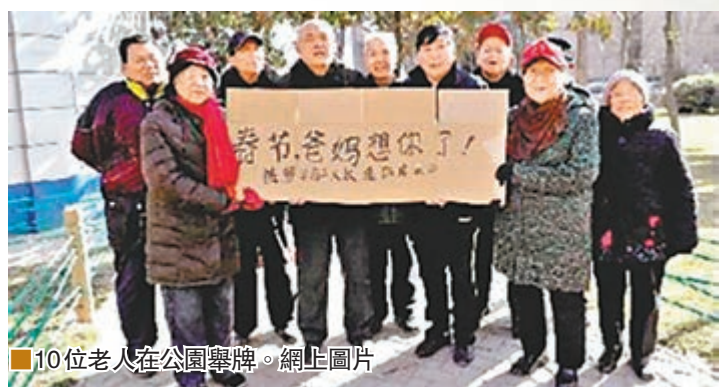
10位老人在公園舉牌。網上圖片

「春節，爸媽想你了！」河南鄭州10位老人近日在公園舉紙板喊孩子回家過年，引來不少市民圍觀。他們一邊舉着紙板，一邊還合唱起《常回家看看》。