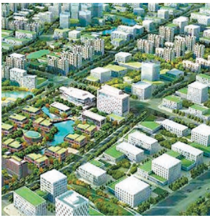
招商局青島網谷效果圖。

招商局集團在青島產業轉型升級的關鍵時期落戶青島紅島經濟區，是對青島產業集聚發展趨勢和政府政策引導的積極響應。