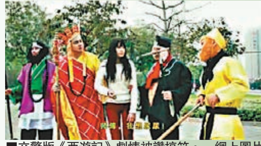
交警版《西遊記》劇情被讚搞笑。網上圖片

廣東惠州交警拍攝的微電影《西遊記》近日熱爆網絡，內容講述唐僧師徒四人再次踏上西遊的征程。大馬路上突然出現的「紅燈怪」讓眾人迷失心竅，險墮陷阱發生意外。幸好悟空出手降服「紅燈怪」，將其打回原形，化解危機。交警部門稱這部《西遊記》肯定有後續。