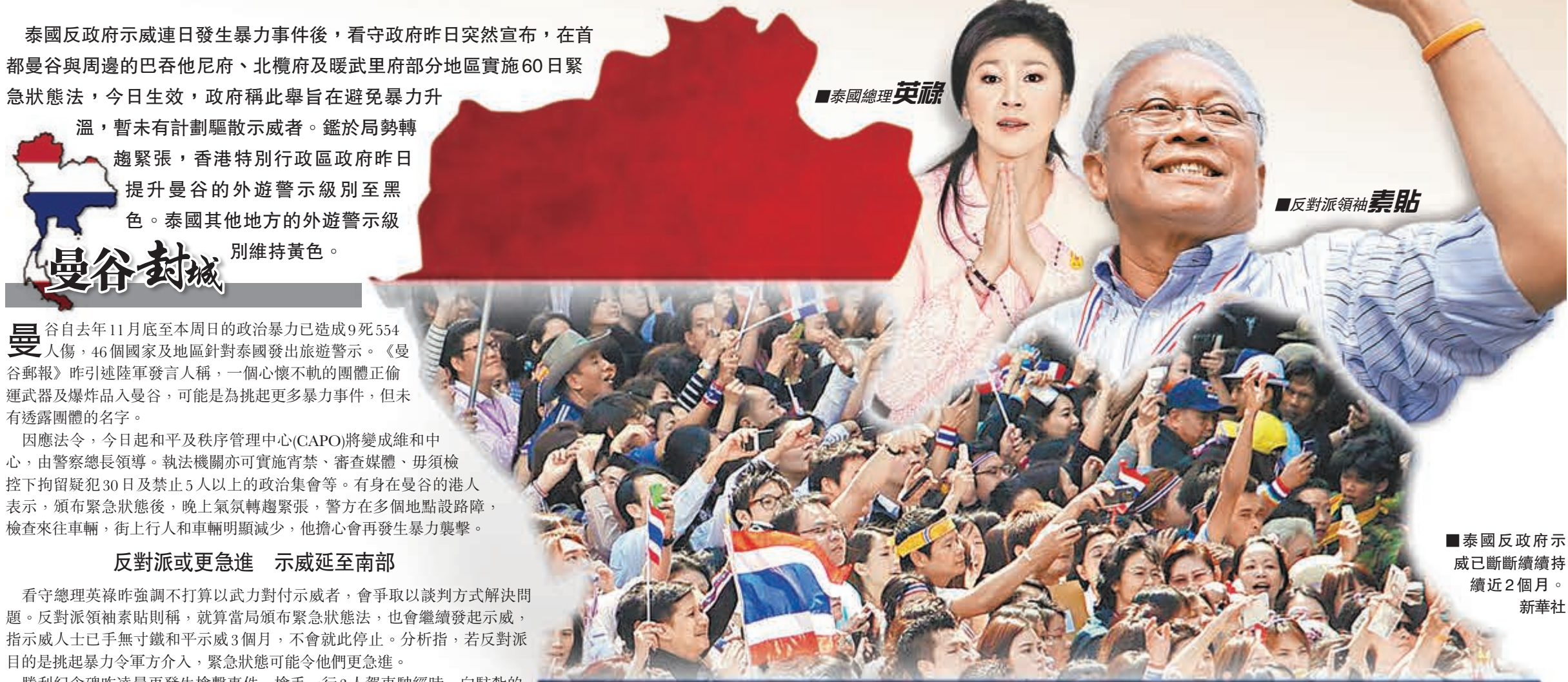
泰國反政府示威已斷斷續續持續近2個月。新華社