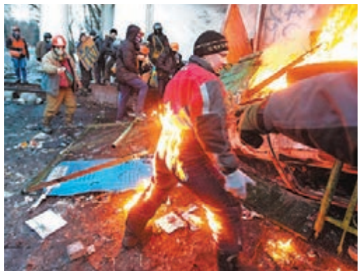
有示威人士在衝突中背部着火。