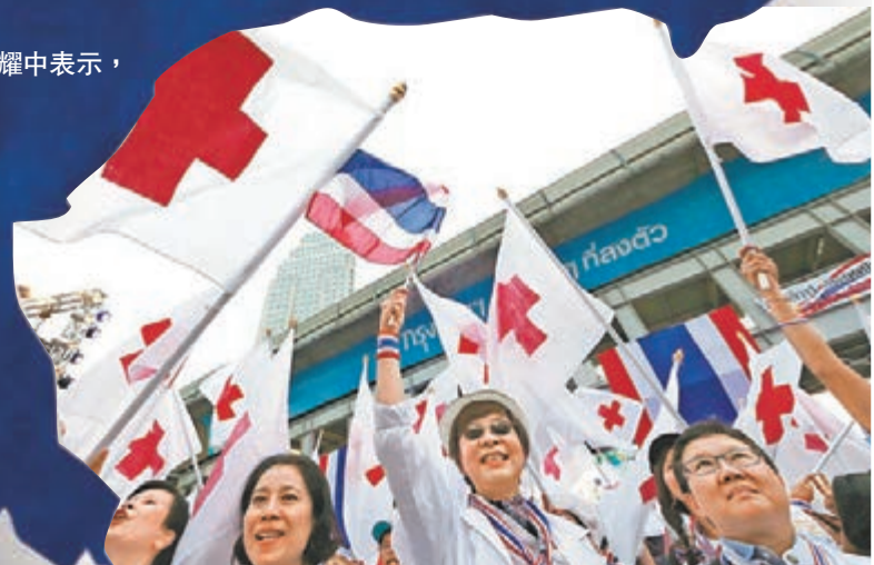
醫護人員高舉十字旗遊行。