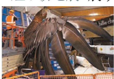
工作人員調整巨鷹雕像位置。

新西蘭北島南部地區昨午3時52分(香港時間昨早10時52分)發生黎克特制6.3級地震，暫未有傷亡或嚴重財產損失報告。首都惠靈頓有強烈震感，機場一個