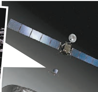
得上與彗星「對接」。過程中，登陸器會向彗核發射特製「魚叉」，以固定在彗核上。