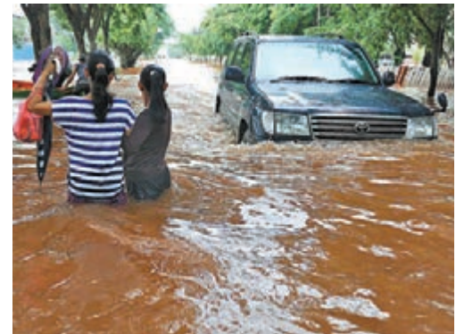
暴雨淹浸人車。

印尼首都雅加達連日豪雨，水災災情慘重。雅加達省政府表示，截至昨日最少有11人喪生，6萬多人安置在避難所，經濟損失估計達數萬億印尼盾。 災情遍布雅加達各地區，包括東雅加達井皮楠、南雅加達賓塔格、西雅加達的聖卡倫和北雅加達的喀拉巴加丁。當局開放200多家寺廟、學校和政府設施收容災民，氣象部門預計未來天氣會轉趨乾燥，有望減緩水災影響。 印尼商會副主席薩曼指出，北雅加達的芒加杜亞、喀拉巴加丁以及東雅加達的嘉丁賈拉水浸最嚴重，光是芒加杜亞全區已導致500億印尼盾(約3,202萬港元)損失。當局預測雨量還未到達高峰，雅加達地區接下來2天還會出現中等至豪雨規模的降雨量。 ■法新社/《華爾街日報》