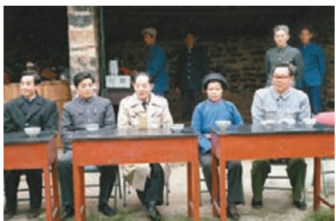
■1986年2月7日，時任中央辦公廳副主任的溫家寶(左一)陪同中共中央總書記胡耀邦(左三)參加貴州春節民族團結聯歡會。左二為貴州省委書記胡錦濤。