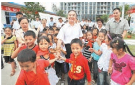
■溫家寶看望四川地震災區孩子。