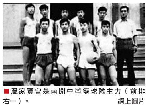
■溫家寶曾是南開中學籃球隊主力(前排右一)。 網上圖片

溫家寶的祖父溫瀛士，字閩仙，生於1895年，17歲投身教育事業，一邊教學，一邊進修。20世紀20年代，溫瀛士在宜興埠一所私立學校任校長。溫瀛士的弟弟溫瀛階，也就是溫家寶的叔祖，後來則是天津一所公立學校的校長。而溫家寶的父母也都是執教多年的老教師：父親溫剛是天津第三十三中學的地質老師，母親楊秀蘭是天津市區一所小學的語文教師。更值得一提的是溫家寶的另一位叔祖，亦即溫瀛士的幼弟溫朋久，早年留學日本、德國，曾當大學教授，新中國成立後當上外交官。