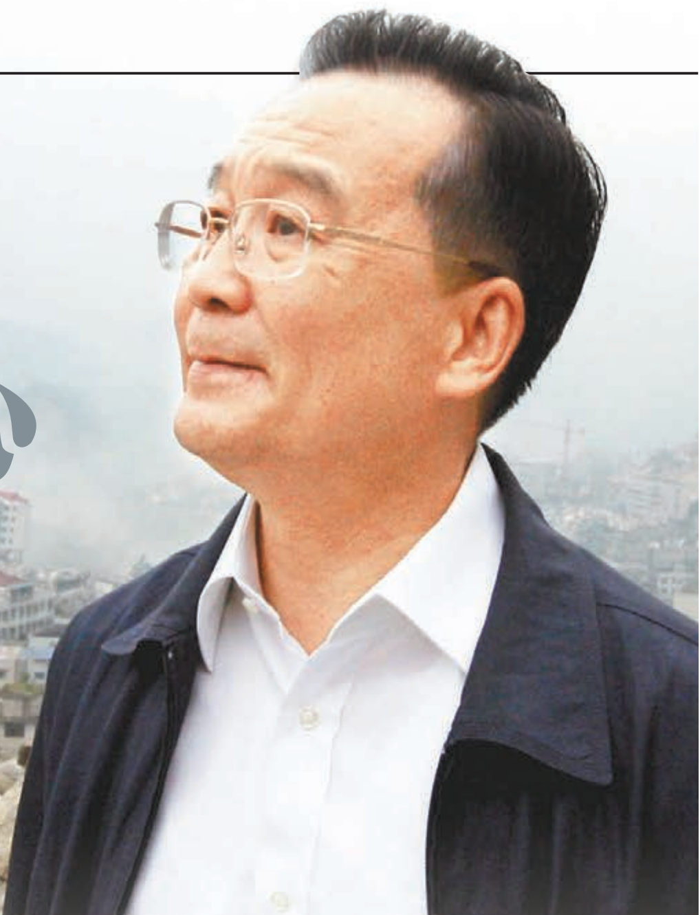
■溫家寶名字寓意「溫加飽」，就是把人民的溫飽放在心上。圖為溫家寶神情凝重地視察四川地震的北川廢墟。 資料圖片

文章稱，溫氏家族世居天津市郊北辰區宜興鎮的溫家胡同8號，相傳溫家先祖6代人都居住在此。長年已久，胡同以溫家姓氏命名。溫家寶也自小在天津長大，1949年，他隨家人搬出了溫家胡同8號，來到南開區西門里達摩庵胡同安下新家。溫氏家族對溫家寶寄予厚望，其名字為祖父溫瀛士所起，叔祖溫朋久注入新解，希望孫子時時勿忘人民的「溫加飽」。