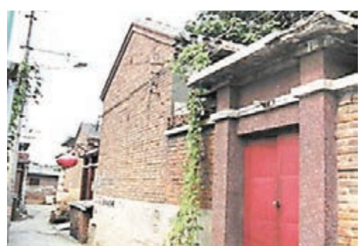
■溫家寶曾住過的溫家胡同八號院。 網上圖片