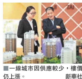
一線城市因供應較少,樓價仍上漲。

香港文匯報訊(記者 劉坤領 北京報道)就內地70個城市樓市繼續上行,逼近2010年市場增長最高點,國家統計局局長馬建堂20日在回答媒體提問時稱,一線城市房價繼續上漲的同時,內地市場出現了比較明顯的分化趨勢,二三線城市總體上比較平穩,個別三四線城市房價出現下跌。 馬建堂表示,去年70個大中城市中,一線城市的房價漲得比較多。一線城市房價上漲有這樣幾個原因:第一,一線城市都是特大城市,人口多,剛性需求和其他需求也都比較強。第二,一線城市由於政治經濟文化比較發達,對流動人口的吸引力是很強的。第三,我們還要承認,一線城市土地資源的稀缺性,尤其是好地段的珍貴性,可能更加明顯和突出。這些因素是去年一線城市房價上漲的深層原因。