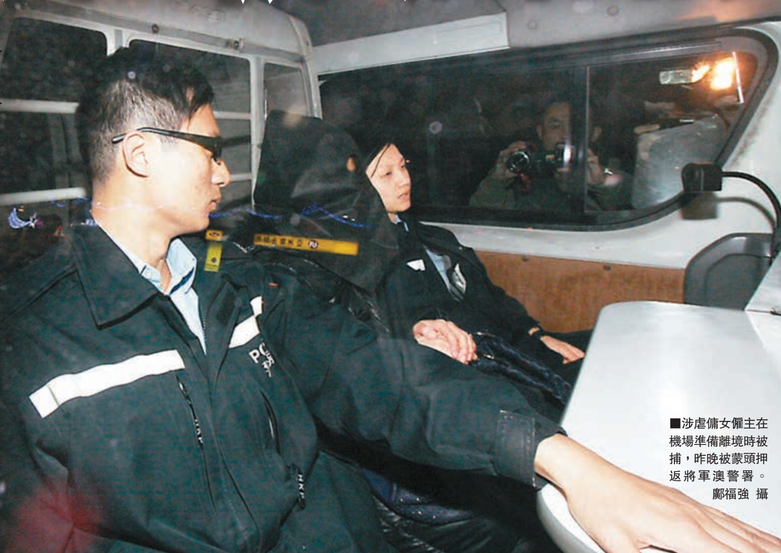
■涉虐僱女僱主在機場準備離境時被捕，昨晚被蒙頭押返將軍澳警署。

涉案被捕女僱主姓羅(44歲)，報稱家庭主婦，在機場被警方扣留後，昨晚8時半由警車載返將軍澳警署，交由負責該案的觀塘警區重案組第二隊調查。羅姓女僱主其後報稱不適送院檢驗。