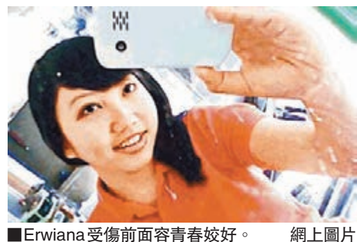
■Erwiana受傷前面容青春姣好。 網上圖片