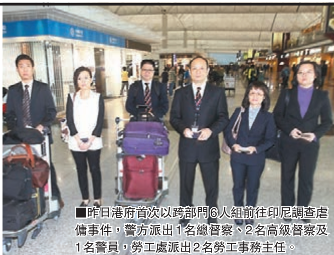
■昨日港府首次以跨部門6人組前往印尼調查虐僱事件，警方派出1名總督察、2名高級督察及1名警員，勞工處派出2名勞工事務主任。