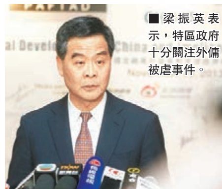
■梁振英表示，特區政府十分關注外僱被虐事件。

香港文匯報訊（記者 文森）行政長官梁振英表示，特區政府十分關注外僱被虐打的事件，強調香港是法治社會，不容許任何暴力行為。保安局局長黎棟國指，政府破天荒派警員及勞工處人員越洋到當地搜證，調查印僱懷疑被虐案，是高度重視案件，並承諾會不遺餘力處理。而勞工及福利局局長張建宗則重申，若有足夠證據，證明僱主及中介公司有責任，一定會追究到底，不會姑息。