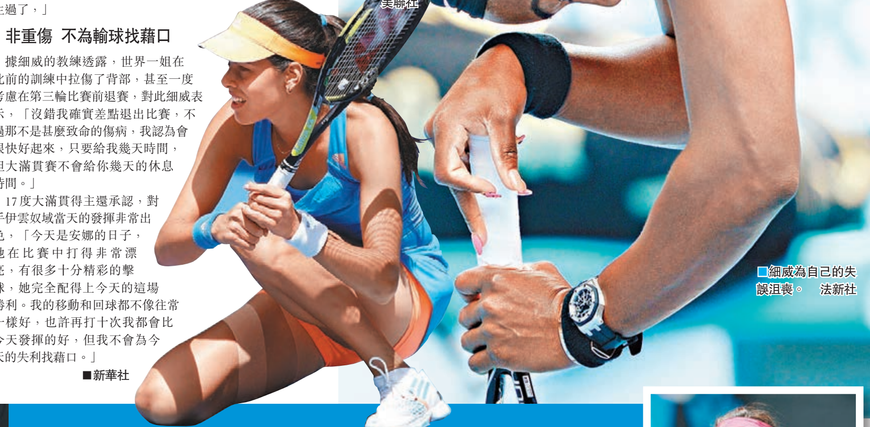
細威為自己的失誤沮喪。