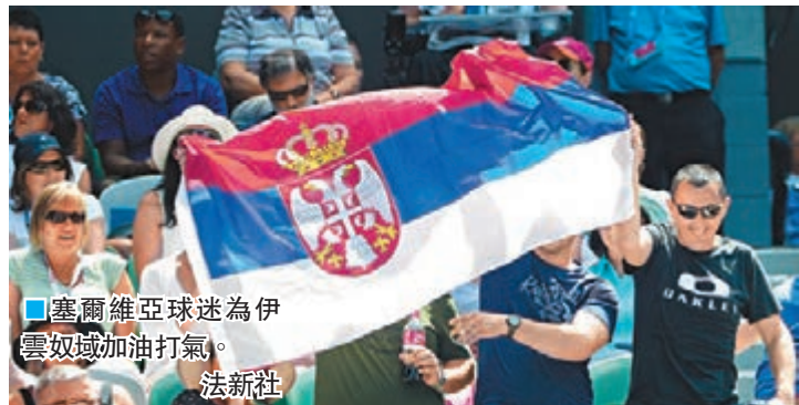
塞爾維亞球迷為伊雲奴域加油打氣。

全場比賽，細威雖然轟出依舊恐怖的13記ACE，但塞爾維亞姑娘在制勝分方面以33：22領先，這其中包括20個正手得分，非受迫性失誤也比頭號種子少了4個。