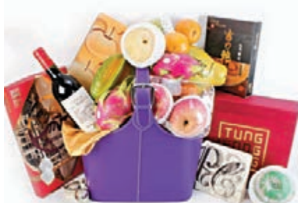
香港郵政推出農曆新年推廣優惠。

農曆新年佳節將至，亦是表達心意的傳統節日。香港郵政即日起及至本月23日期間，呈獻多款農曆新年精選禮籃，方便顧客送禮自用。精選禮籃分為四大款式，分別是新式、傳統、日式及西式，部分更附有金色鮑魚擺設，售價介乎488元至1,988元不等，市民可經香港郵政網上購物坊「樂滿郵」選購。為確保禮籃可於農曆新年前派送至海外地址，市民需於本月15日或之前訂購；至於派送至本地地址的禮籃，則需於本月23日或之前訂購。