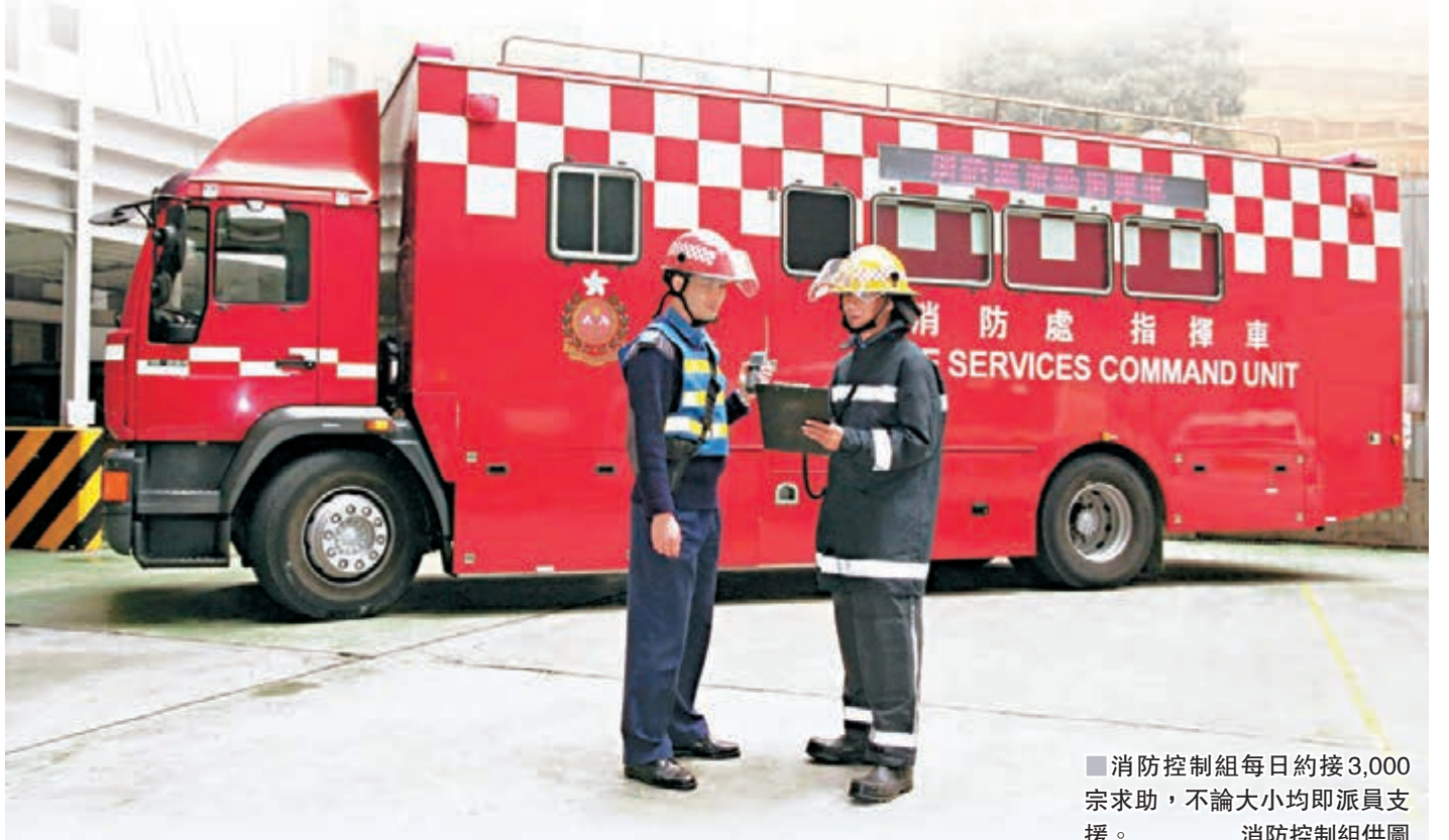
消防控制組每日約接3,000宗求助，不論大小均派員支援。