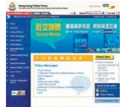
警務處新網頁加入圖標橫額，顯示最新資料。

而網頁中間部分的圖標，亦展示出其他警隊資訊及項目，包括警察信息、防止罪案、警察招募、交通事項、青少年圍地、香港輔助警察隊、牌照/許可證和電子報案室，令市民一上警隊網頁，就可對警方工作的概況一目了然。