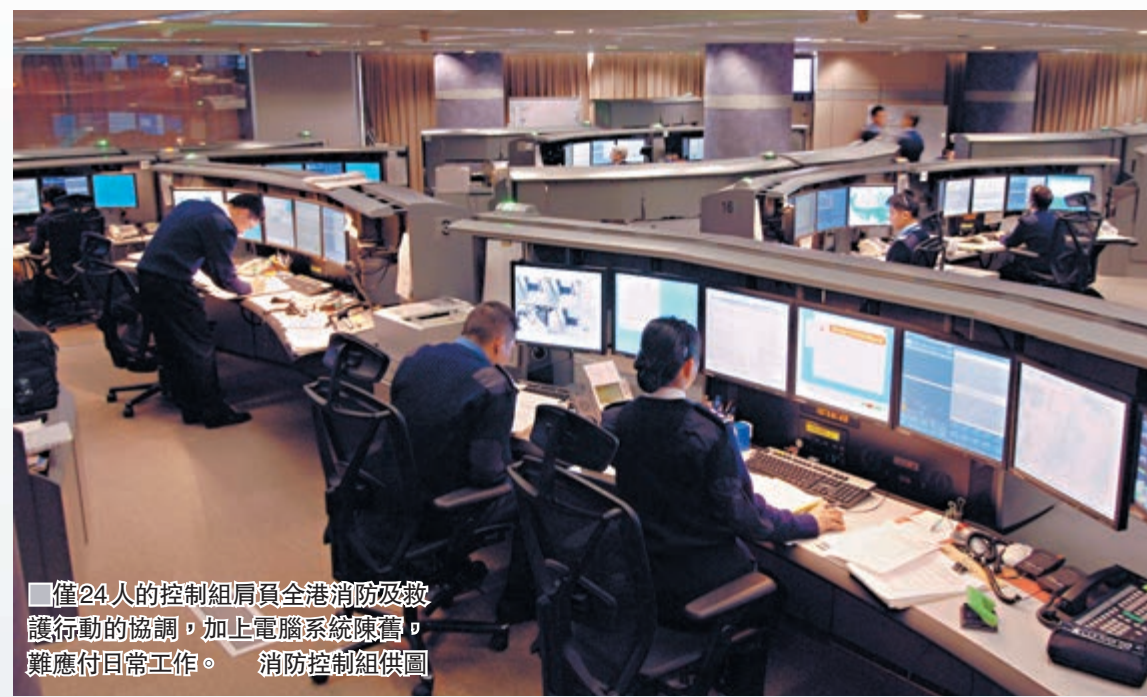
僅24人的控制組肩負全港消防及救護行動的協調，加上電腦系統陳舊，難應付日常工作。