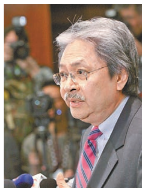
■在施政報告發表後的當天，財政司司長曾俊華已「預告」下年度財政預算的經常性開支約增加200億元。 資料圖片