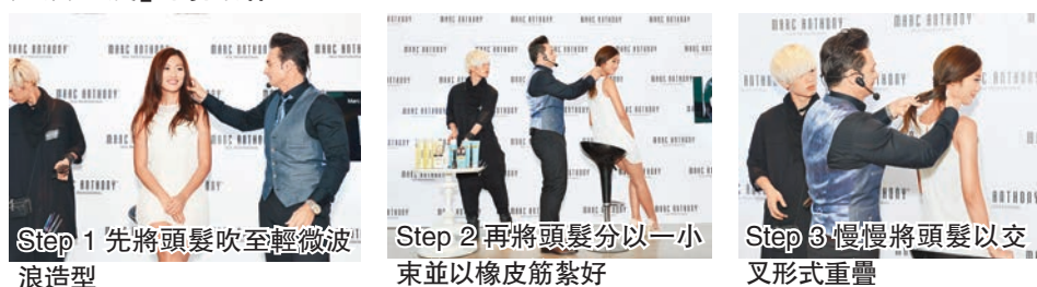
Step 1 先將頭髮吹至輕微波浪造型 Step 2 再將頭髮分以一小束並以橡皮筋紮好 Step 3 慢慢將頭髮以交叉形式重疊

農曆新年轉眼又到，每逢過年髮型屋必定大排長龍，不想浪費幾個小時Set頭，又或不想浪費髮型師為你設計好的新髮型，好的護髮及頭髮造型系列是你辦年貨時必掃項目之一！長久缺乏護理、經常改變髮型、染髮、電髮會令髮絲受損，新髮型的效果亦會大打折扣，一系列品牌的全新護髮及頭髮造型系列，提供度身訂做而開發的產品，令一眾無論直髮、曲髮、受損暗啞或是任何髮質髮型的人士，都能找到處理各種頭髮問題的解決方案。就在這個新春佳節以一襲迷人亮麗的髮絲，為來年作個最容光煥「髮」的開始吧！