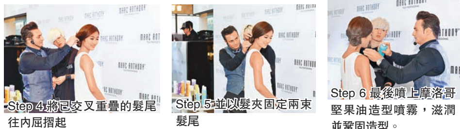
Step 4 將交叉重疊的髮尾往內屈摺起 Step 5 並以髮夾固定兩束髮尾 Step 6 最後噴上摩洛哥堅果油造型噴霧，滋潤並鞏固造型。

聞名於國際的荷里活星級造型師 Marc Anthony (馬克安東尼)，憑藉其對髮型設計的天賦及多年的經驗，一直深受全球巨星的愛戴，屢次與世界級的名人和節目合作，不斷為髮型界創造經典。其所創立同名護髮產品系列，亦旨在照顧對頭髮護理與獨特造型有需要的顧客，為他們提供量身訂做而開發的產品。令一眾無論直髮、曲髮、受損暗啞或是任何髮質髮型的人士，都能找到處理各種頭髮問題的解決方案，甚至能輕鬆在家自我打造荷里活巨星的星級髮型。今次，他示範如何將日常所見的髮型以短短數分鐘配合 Oil of Morocco 產品系列輕易打造荷里活星級髮型。