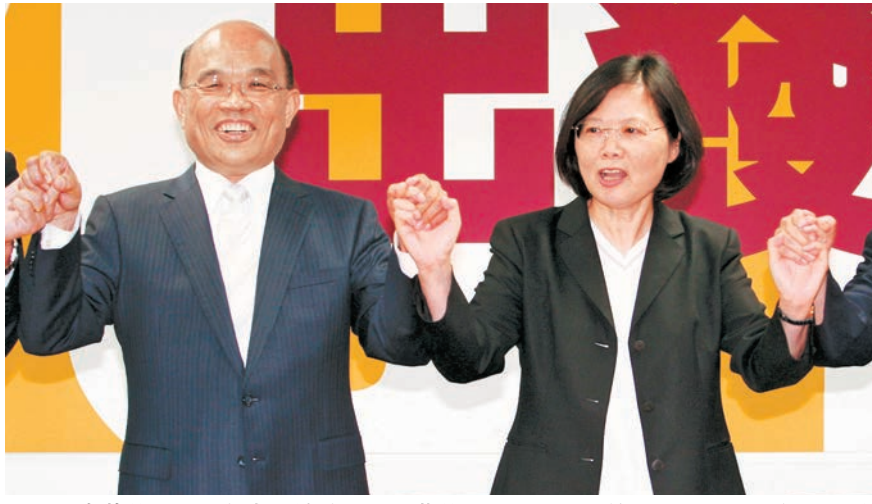
民進黨黨菁英民調，蘇貞昌輸給前主席蔡英文兩成，跌至第3位。

另外，蔡英文昨天回應此事時表示，她沒有看過這個民調，無法評論，但覺得應該把重點放在民進黨是否整隊完成，發揮政党的功能，讓社會對民進黨有信心，讓民進黨可以帶領台灣改變，讓台灣有好的未來。