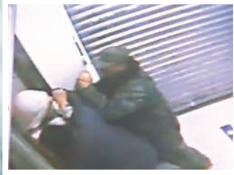
劫匪反被父子兩人制服。