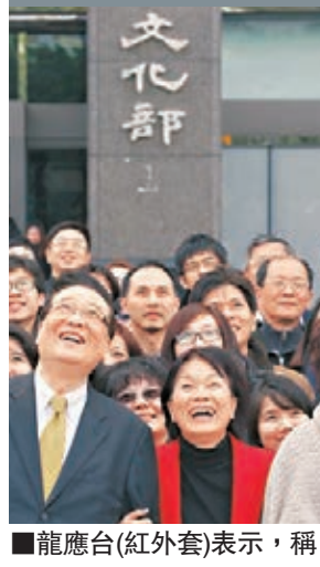
龍應台(紅外套)表示，稱我部長才訪陸。

香港文匯報訊 綜合報道，文化部長蔡武日前透過前台北故宮院長周功鑫傳話，冀「龍應台女士」能以適當身份訪問大陸，但龍應台開出條件：強調自己是「部長」，且應在兩邊社會都受到足夠尊重的的前提下，以適當身份進行，才能落實。