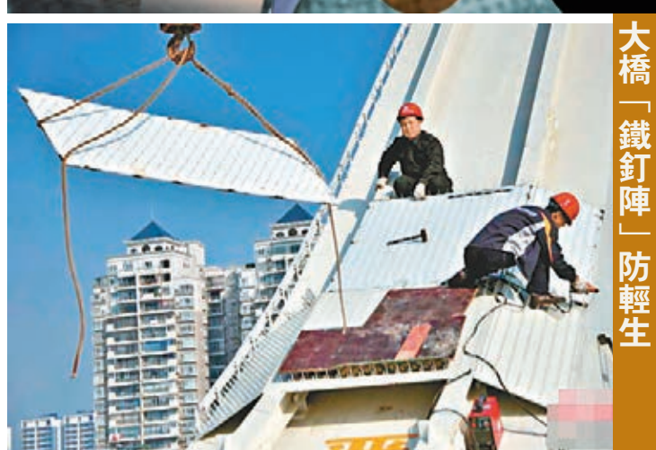
大橋「鐵釘陣」防範生

廣西柳州市新建成的廣雅大橋上，施工人員日前在橋拱焊接「鐵釘陣」，以防有人爬上橋拱輕生或者跳橋。因追討薪金、感情糾紛等原因，常有人爬上作為城市交通主幹道的大橋橋拱上掛橫幅和輕生，造成這些城市交通癱瘓。